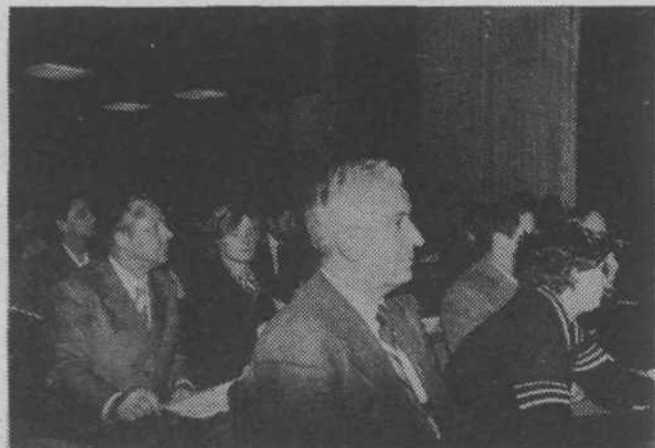
Jasne in odločne besede komunistov ob gospodarskem trenutku

mov gospodarjenja, ki smo jih opredelili že v začetku leta in tedaj nakazali tudi smeri reševanja, nismo bili dovolj učinkoviti, saj so se problemi