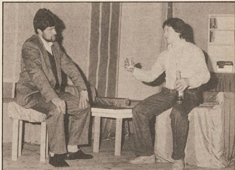
Namišljeni bolnik v pogovoru s prijateljem, ki mu je hotel že pripraviti nagrobni govor.