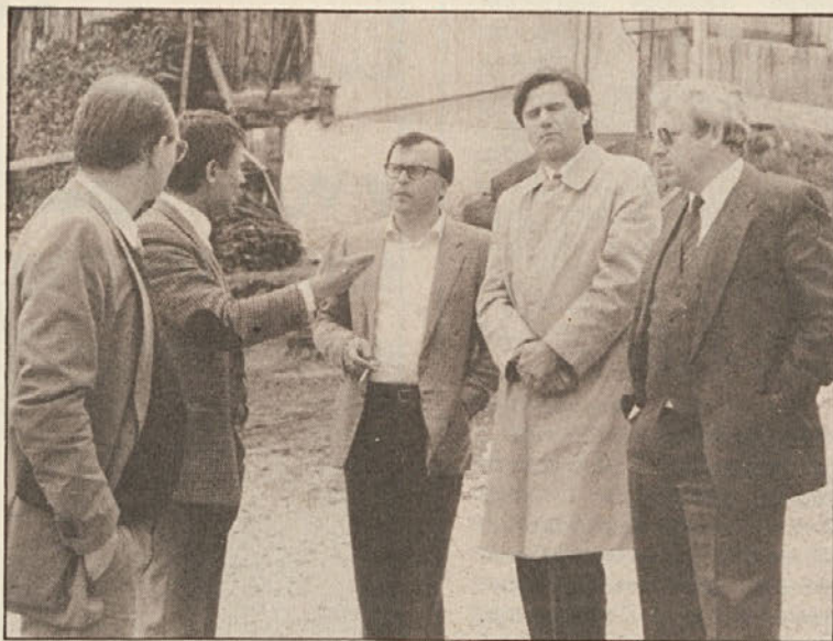
Delegacija Koroške enotne liste se je mudila prejšni teden na obisku pri Ladincih na Južnem Tirolskem. (Več na str. 3)

Omembe vredno je dejstvo, da se južnokoroški občan — v smislu volilnega proglasa KEL — predvsem pa slovenskogo-voreči, vse bolj odteguje varuštvu koroških deželnih strank. To dokazujejo podatki