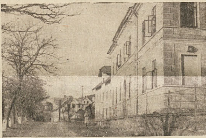
Hrib — Loški potok