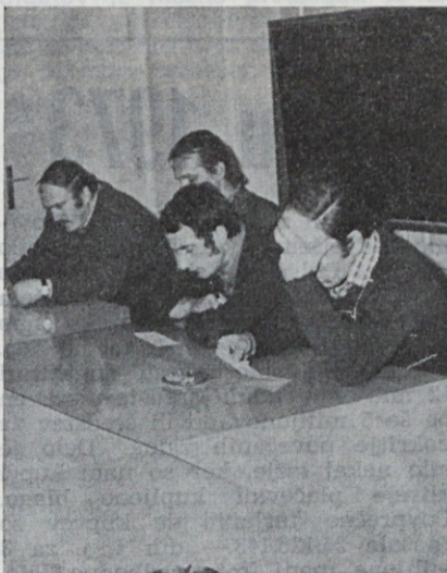
Visoka koncentracija pri preizkusu znanja

Glede na takšno gospodarsko situacijo doma in v svetu lahko pričakujemo, da nam bodo proizvodni stroški vztrajno rasli in da nam bo pričelo primanjkovati ustreznih obratnih sredstev, kar vse ima v končni fazi za posledico tudi ukinitve določene proizvodnje ali izpad kakšnega finalnega izdelka iz našega proizvodnega programa.