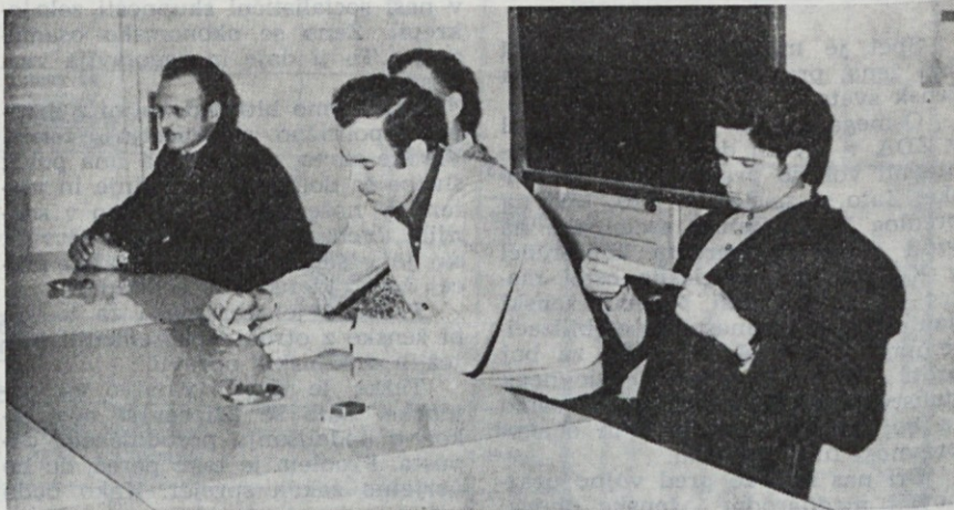
Delavci iz oddelka belilnice — vprašanja so bila zahtevna