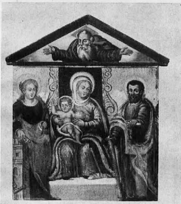
Oljnata slika, predno je bila restavrirana. Sedaj jo je župnija Milje vrnila cerkvi sv. Barbare v Miljskih hribov. Visi v novozgrajenem prizidku.