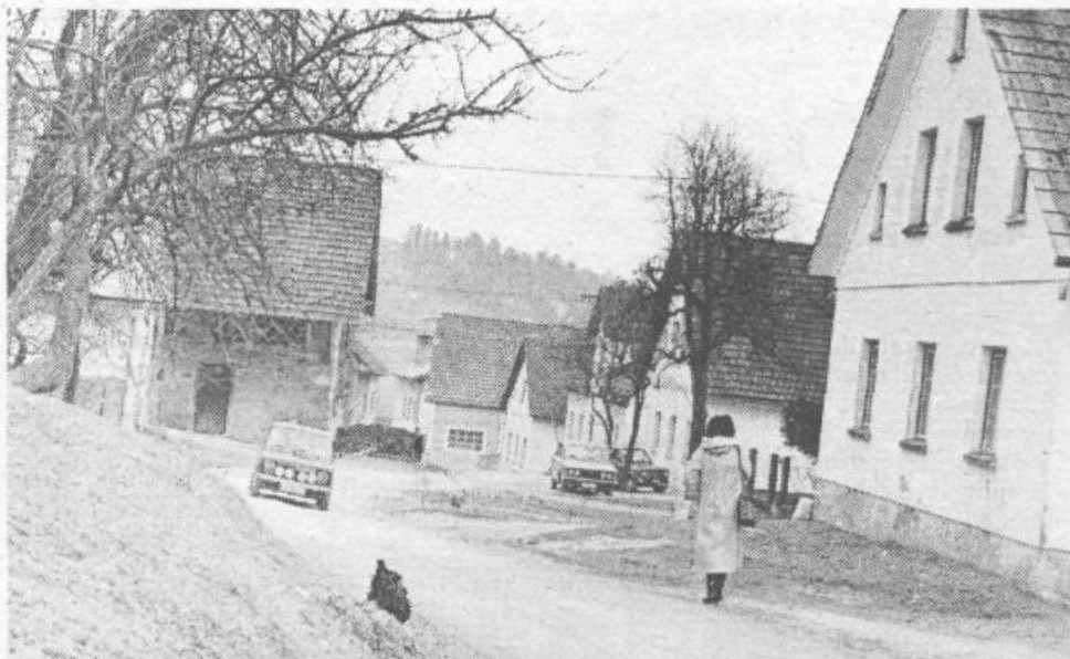
Asfalt bi rešil Zaklančane nadležnega cestnega prahu

Jože Prebil: »Kmetje pričakujemo, da bodo delavci TOZD Hidrogradnje upoštevali naše predloge ter, da bodo kmalu rešeni zemljiški zapleti na nekdanjih arondiranih površinah.«