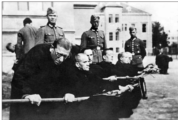
Frančiškani v meljski vojašnici v Mariboru aprila 1941.

V celoti je bilo aprila in maja 1941 izgnanih 80 patrov in bratov. Večina se jih je naselila po samo-