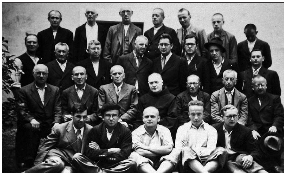
Francišškani iz lavantinske škofije, leta 1941 pregnani na Hrvaško.

Začetek druge svetovne vojne in okupacija slovenskega ozemlja sta med samostani najbolj prizadela tiste na nemškem zasedbenem ozemlju. Slovenska frančiškanska provinca je imela na tem območju šest samostanov in eno rezidenco. Nemški uničevalni načrt je predvideval izselitev vseh izobražencev, med katere so bili prišteti tudi duhovniki in redovniki. V