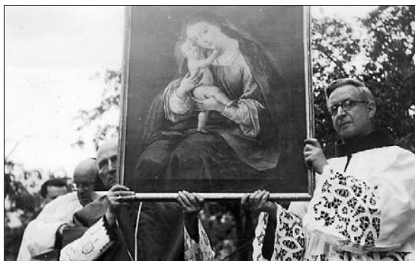
Vrnitev slike na Brezje leta 1947.