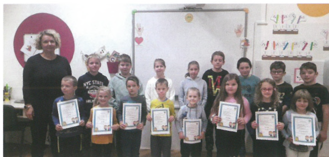
UČENCI 5. RAZREDA PRIPRAVILI SPREJEM PRVOŠOLCEV V ŠŠ