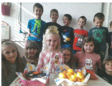
...slavimo rojstne dneve...