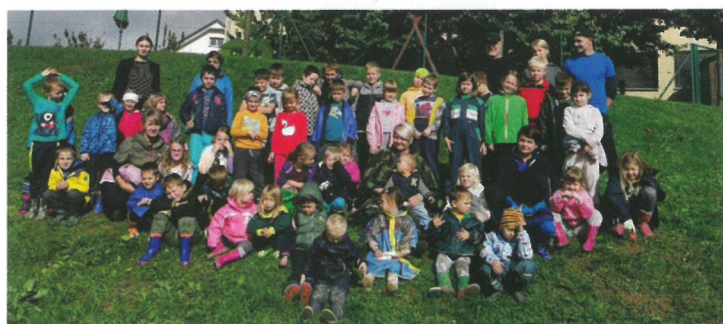
ŠOLSKA TRGATEV PONOVNO ZDRUŽILA VELIKE IN MALE »BRAČE«