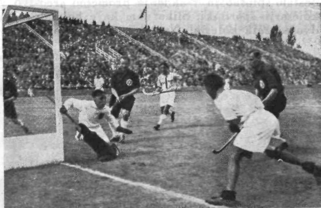
Hokej tekma Indija - Nemčija.

nam prikazuje Indijce (beli) v boju z Nemci (temni). Tekmovalci podé s posebno ukrivljenimi palicami trdo žogo v nasprotnikova vrata. Igralno kroglo (160 g, 23 cm) smeš premikati samo s palico, le vratar, ki brani vrata, jo sme loviti tudi z rokami. Slika nazorno kaže skrbnega vratarja, ki je pripravljen za vsak slučaj z rokami in nogami, da prestreže strel. Spustil se je kar na tla, saj ima noge močno zavarovane s posebnimi ščitniki.