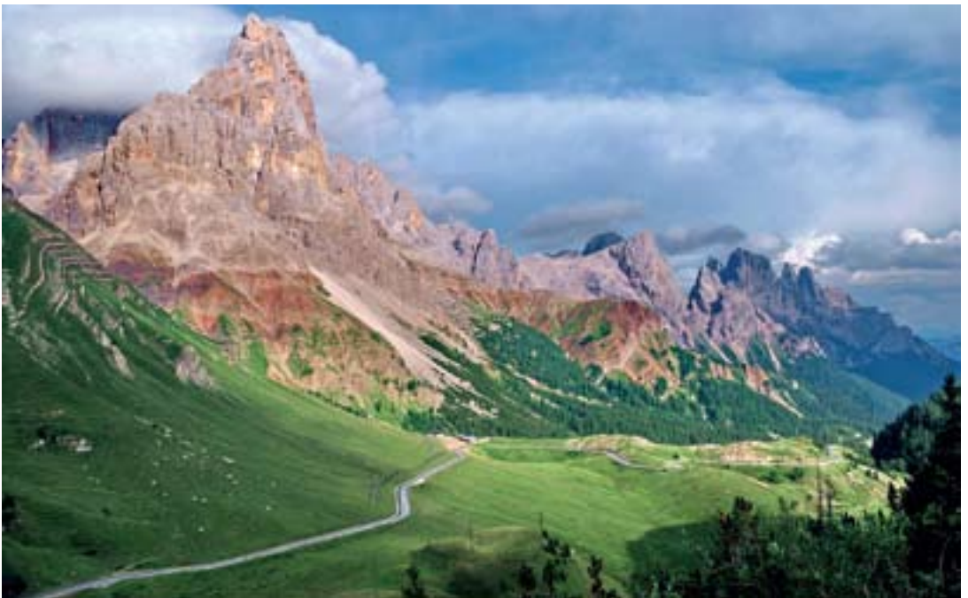
Dolomitski »Matterhorn« – Cimon della Pala

Na vsaki dve leti zaseda najvišji organ Alpske konvencije, tj. Alpska konferenca, na kateri se srečajo okoljski ministri držav pogodbenic. Alpska konferenca obravnava cilje in določa politične smernice za izvedbene dejavnosti. Ena od pogodbenic po načelu rotacije prevzame predsedovanje Alpski konvenciji za obdobje dveh let. Na pravkar končani X. konferenci v Evianu je 12. marca Slovenija od Francije prevzela stafeto vodenja dveletnega