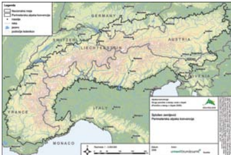
Karta območja veljavnosti Alpske konvencije

Poselitev prebivalstva je v Alpah osredotočena na večje in prometno lahko dostopne doline (Aosta, Rona, Adiža, Inn, Valtellina) in kotline (Celovška kotlina) ter vzdolž alpskega obrobja. Gostota prebivalstva v občinah ne odraža realnega stanja v alpskem loku. Zaradi strmine in višine terena je le manjši del celotne površine alpskega območja primeren za stalno poselitev. V značilni alpski regiji, kot je npr. Južna Tirolska, je za stalno poselitev primernih le 8 % površine, na avstrijskem Vorarlberškem pa ta vrednost dosega 24 %.