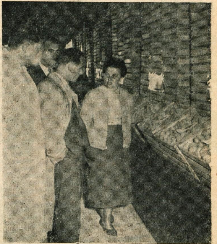
Naklo, 11. oktobra.