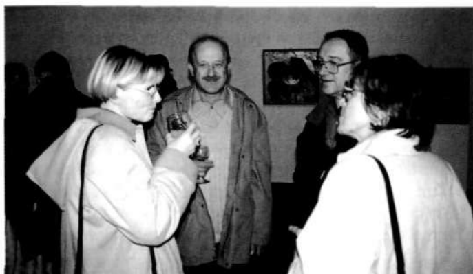
Prijateljsko srečanje po občnem zboru muzejskega društva.