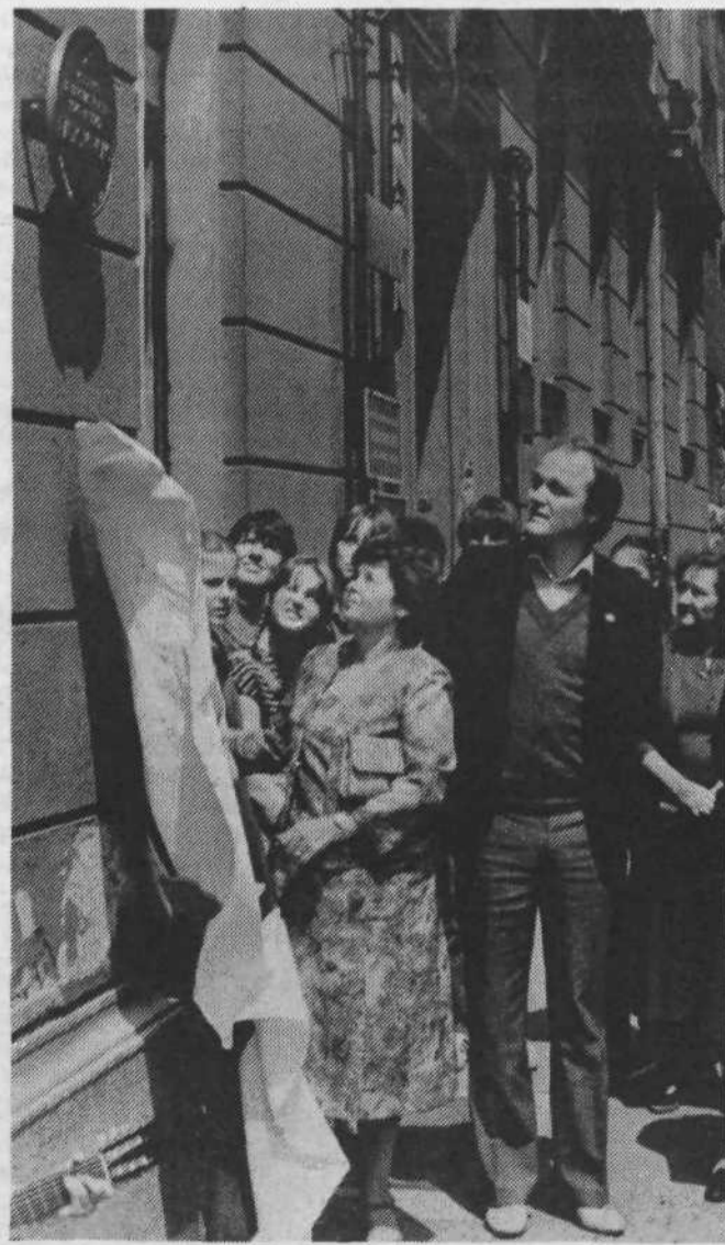
Predstavniki RTV Ljubljana so ob letošnjem dnevu radia in televizije odkrili spominsko ploščo radiu Kričič na hiši v Cigaletovi 5.