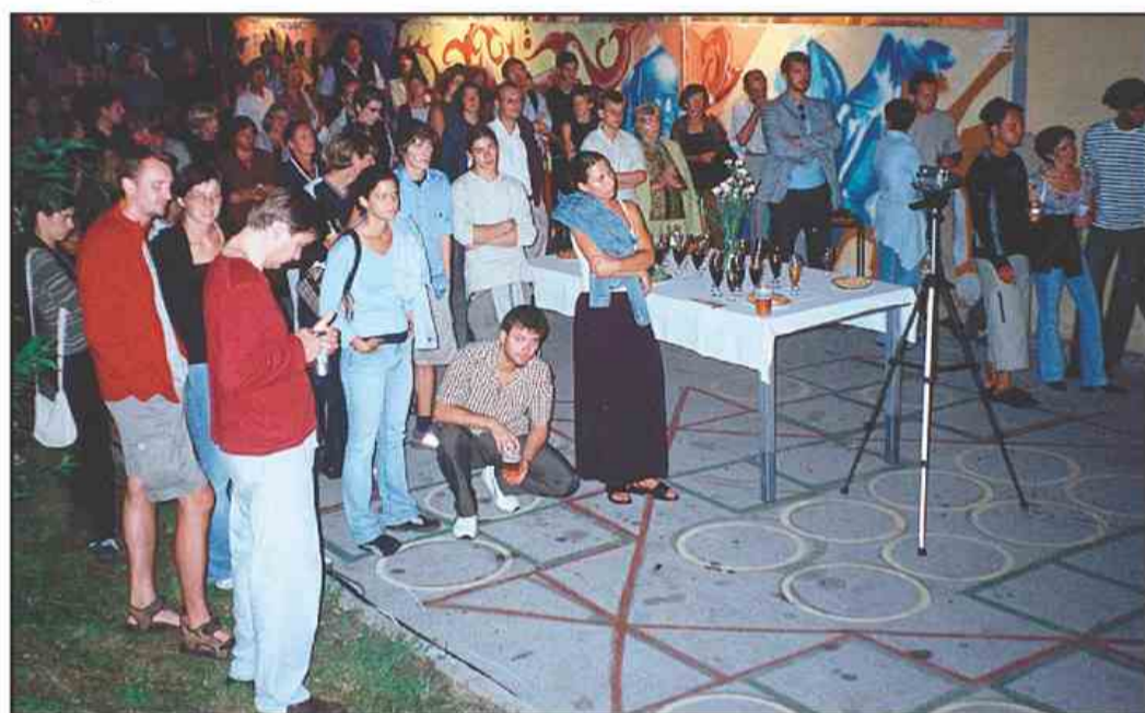
Otvoritev letošnje Kunigunde je pritegnila precej ljudi

Na osrednjo prireditev ob prazniku so letos povabili tudi predsednika Državnega zbora RS Boruta Pahorja. Potrditve ob koncu minulega tedna še niso imeli, upajo pa, da vabila ne bo zavrnili. ■ bs