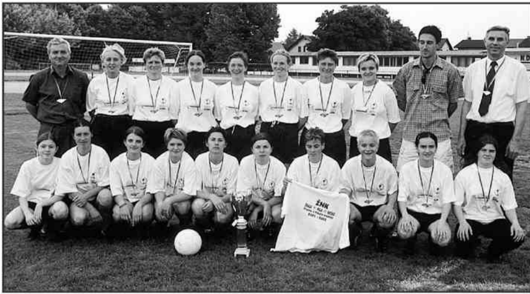
Z zadnje tekme z Ilirjo v Ljubljani, ko so tudi uradno postale državne prvakine

Kot so povedali predstavniki organizacijskega odbora na novinarski konferenci, morata biti zadnji dve tekmi ob isti uri, saj se zna zgoditi, da bosta odločali za uvrstitev v ligo prvakinj. Obe se bosta začeli ob 15. uri.