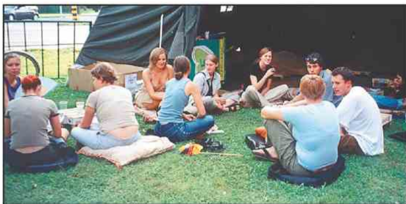
V počivalnici na zelenici pred Mladinskim centru lahko uživate ob čaju, glasbi in dobri družbi.