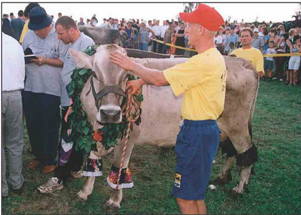
Misica Sila je bila res sila. Stroge oči članov komisije so najbrž navdušili tudi njeni volančki.