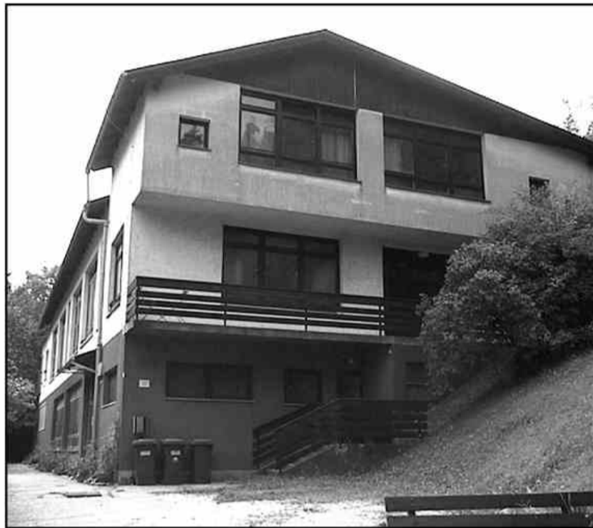
Podružnična šola v Paki bo letos samevala.

Na obeh šolah v občini Šoštanj ugotavljajo, da število učencev še nadalje pada, in da tudi v zadnjem letu osemletnega programa zaradi načrtovane izgradnje nove šole niso opravili nič drugega kot res najnujnejša vzdrževalna dela.