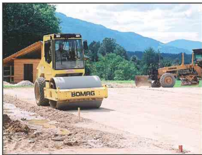
Pripravljalna dela pred asfaltiranjem igrišča na lazah so opravili krajanje, gradbena dela pa gradbinci Gozdnega gospodarstva Nazarje

Asfaltirali ga bodo že v naslednjih dneh, do občinskega praznika pa bo nedvomno pripravljen mali stadion za različne športne prireditve. Sredstva za stroj za igrišče so prispevali iz skromnih virov krajevnih društev ter krajevne skupnosti, opravili so več sto ur prostovoljnega dela in skoraj sto traktorskih ur v skupni vrednosti dober milijon tolarjev, tri milijone za asfaltiranje pa bo primaknila občina Nazarje. Krajanje si želijo ob tem asfaltirati tudi tri-