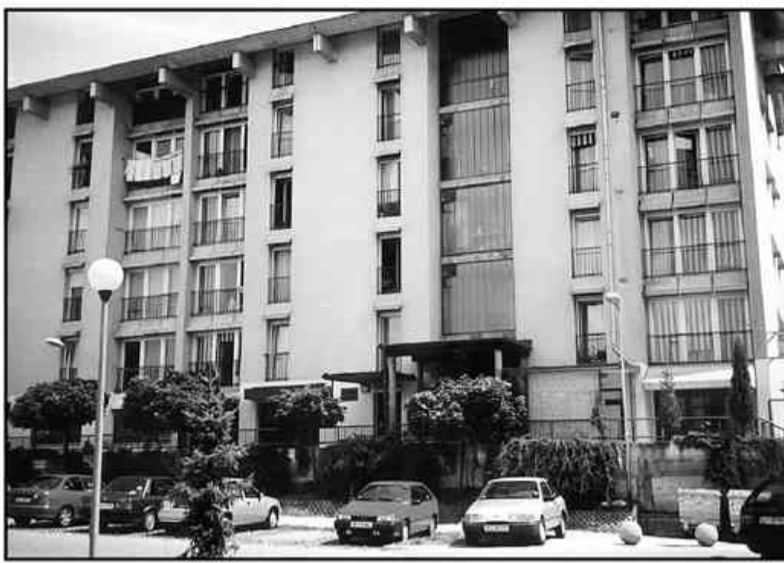
Po zunanjem izgledu tisti, ki ne vedo, da je v tem bloku samski dom Premogovnika Velenje, tega ne morejo ugotoviti. Sploh, ker je prva polovica stavbe že nekaj časa spremenjena v stanovanja za družine.

Odločili smo se, da običajno samski dom v samem središču mesta, na Kidričevi 57. Na zunaj prav z ničemer ne kaže, da