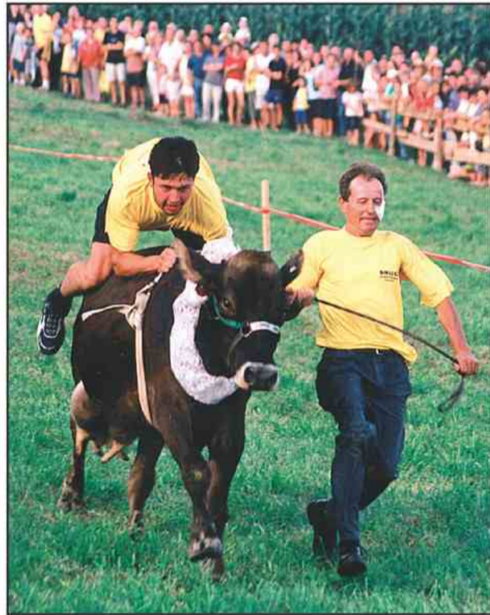
Savinja je tekla kot blisk.