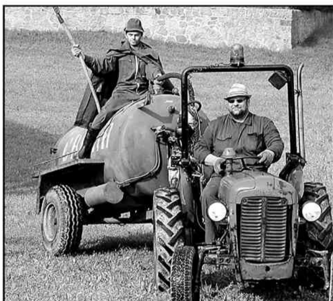
Krst je bil tokrat zelo moker in obarvan z agrarno tematiko. Veliki žbičelj se je pripeljal kar na cisterni z gnojevko.

drugi dan pričeli naše raziskovanje. Delo je potekalo v 15 različnih skupinah, pod vodstvom malo več kot 20 mentorjev. Geologi so se ukvarjali predvsem z izdelovanjem geološke karte, geografi s popisovanjem divjih odlagalšč in anketiranjem prebivalcev Šmartna ob Paki, geološka skupina je obravnavala problematiko voda, zoologi pa so si čas krajšali s popisovanjem ptic in gliv ter s preučevanjem plazilcev in dvoživk. Med raziskovalci pa so se, kljub prvotnim dvomom, našli tudi tisti, ki jim dodatna možganska rekreacija ni bila odveč. Mednje so spadali predvsem matematiki, ki so na takšen in drugačen način spoznavali čare matematike. Arheologi, arhitekti in zgodovinarji pa so se ukvarjali pred-