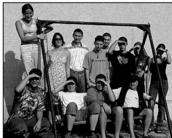
Med najbolj aktivnimi smo bili kot ponavadi mladi novinarji.

predvsem tiste, ki so si vsaj za trenutek želeli postati svetovno znane osebnosti na glasbeni sceni. Za najboljše so bile pripravljene tudi privlačne nagrade, a so karoke, bolj kot v tekmovalnem, minile v zabavnem duhu. Piko na i našemu raziskovanju pa smo dodali z razstavo naših končnih izdelkov, fotografij in plakatov, ki smo jo pripravili pod budnim vodstvom mentorjev. Za konec smo si ogledali še dokumentarni film, ki je našim staršem, prijateljem in krajanom pokazal, kaj smo počeli ta teden dni. Pred odhodom, pa smo vse obiskovalce presenetili z glasbenim spotom, ki ga je pripravila novorojena skupina Bešmart.