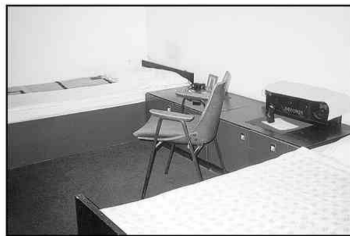
Samski dom na Kidričevi je čist, sobe so lepo urejene, najemniki pa zadovoljni.