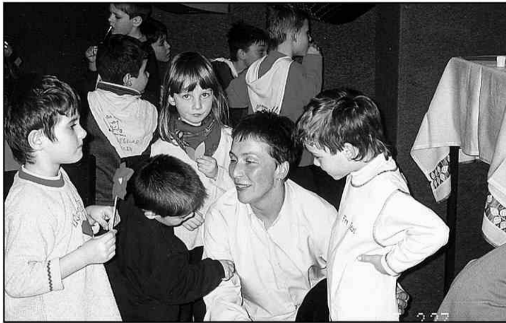
Letos so v Vrta Šoštanj v precejšnji meri napolnili oddelke.

Vsebinsko so aktivnosti v novem šolskem letu zastavili tako kot to predvideva lani uveden program Korekul. Ta prinaša vrsto novosti, ki med drugim spreminja utečene navade zaposlenih, postavlja zahteve po pridobivanju novih znanj ter spretnosti. Poleg varstva in vzgoje bodo - pravi Žerjavova - otrokom ponudili še vrsto dodatnih dejavnosti. Vodijo jih njihove vzgo-