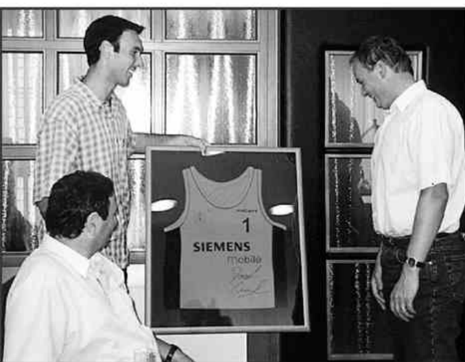
David je županu podaril dres s katerim je zmagoval.

POSLOVNO-KOMERCIJALNA ŠOLA CELJE POKLICNA IN STROKOVNA ŠOLA Kosovelova 4, Celje