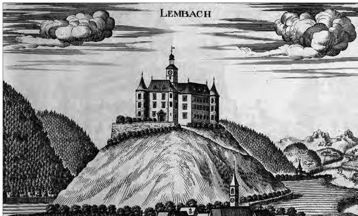
Limbuš v 17. stoletju (Vischer, Topographia Ducatus Stiriae, 1681).

najverjetneje se ne motita. 37 To lahko trdimo že zato, ker med pričami omenjenega dejanja najdemo tudi dva moža po imenu Wdalricus de Marpurch et frater eius Gotfridus . Očitno je šlo za mariborska brata, ki sta v istem času že imela v rokah novi grad Viltuš in sta, prav tako kot Leopold, samostanu iz rok trgala posesti. 38 Zdaj sta pri tem očitno pomagala še svojemu sorodniku Leopoldu, ki si je na samostanski zemlji v Kamnici na silo postavil grad. Prav tako se je polastil še neke druge šentpavelske vasi, imenovane Vollenanger . Da bi grad opustil in mu vas vrnil, je bil opat Leopoldu prisiljen izročiti 20 srebrnih mark, 39 česar gotovo ni storil z veseljem.