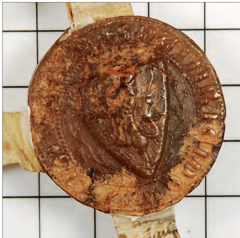
Pečat Henrika IV. Viltuškega (SI AS 1063, št. 5790, 1325 IX 14).