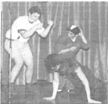
Ena iz tistih

Da ne bi pozabili! Kot smo napovedali v decembrski številki Odseva, se je v trzinški dvorani tretjo nedeljo v januarju odgrnila zavesa in prižgali so se reflektorji za "impro ligo", v kateri sta se pomerili dve gledališki skupini: naša domača, ki sliši na ime Franc K. in gledališče Ane Monroe. Tisti, ki so si prišli improvizacije na odru ogledar od blizu, so se krepki dve uri zabavali. Prvo nedeljo v februarju pa sta se prav tako trzinška skupina, ki se tokrat odziva na ime Cooltourzinka, in skupina šentjakobskega gledališča srečali v okviru improlige v KUD France Prešeren v Ljubljani.