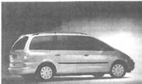
ALHAMBRA je enoprostorsko vozilo s 5 do 7 sedeži primerno za večje družine, podjetja in obrtnike.

Za informacije jih lahko pokličete na tel. 716 - 262, še boljše pa je, da jih obiščete, saj vam bodo izkušeni prodajalci gotovo lahko dobro svetovali; odpeljali pa se boste lahko tudi na testno vožnjo.