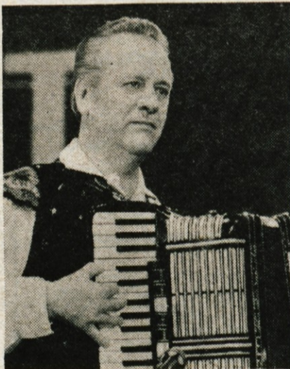
Slavko Avsenik, vodja ansambla, stalno ustvarjalni glasbenik, mojster harmonike brez primerjave...