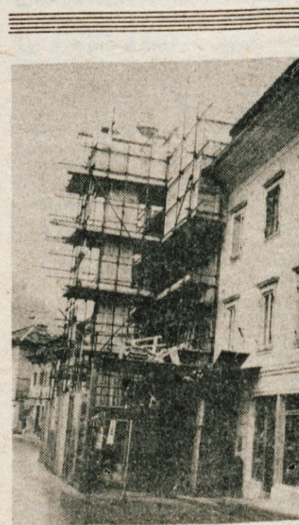
Tržič — V okviru programa revitalizacije starega mestnega jedra so se Tržičani lotili prenove Koželjeve hiše na Trgu svobode 11. V njej bodo predvidoma do občinskega praznika pridobili šest sodobnih stanovanj.