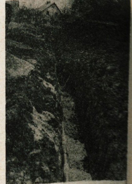
Boljša preskrba z vodo — V naslednjih Smednik in Zbilje so doslej zaradi pre slabega vodnega pritiska poleti pogosto ostajali brez vode. Zato zdaj polagajo novo vodovodno napeljavo od Podreče do Zbilj, kar bo prispevalo k boljši poletni oskrbenosti. Dela bodo veljala 4 milijone dinarjev, sredstva pa je zagotovila občinska skupščina Ljubljana Šiška.