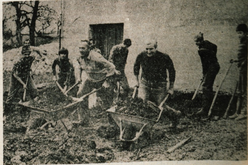
S prostovoljnimi delom bodo zgradili v Besnici tudi garažo za gasilski avtomobil.