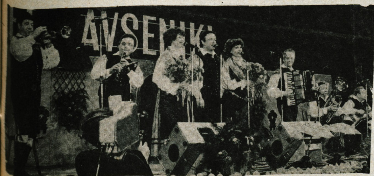
»Vodujujoče so na petkovem jubilejnem koncertu na Bledu zaigrali Avseniki