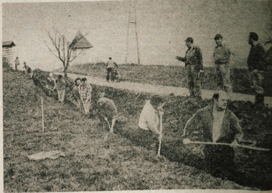
Pripravljalnih del za izgradnjo mrliških vežic se je na prostovoljni delovni akciji pred dnevi udeležilo 45 krajanov.

društev. Dobro dela tudi delegacija v zboru krajevnih skupnosti občinske skupščine, več težav pa je s konferenco delegacij za samoupravne interesne skupnosti. Med zares delovnimi velja še posebej omeniti Radio klub in turistično društvo. Slednje bo letos 4. julija praznovalo 30. obletnico delovanja. Skupnost bodo združili s krajevnim praznovanjem in se že pripravljajo na raz-