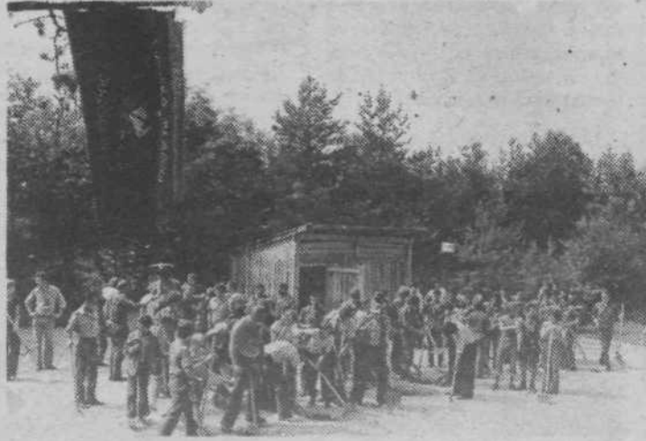
Če je treba, primemo za vsako delo

Želja mladih je bila, da praznujemo skupaj s Titom. Zato smo si izbrali za svoj praznik Titov rojstni dan. Prikazujemo različne dejavnosti mladih.