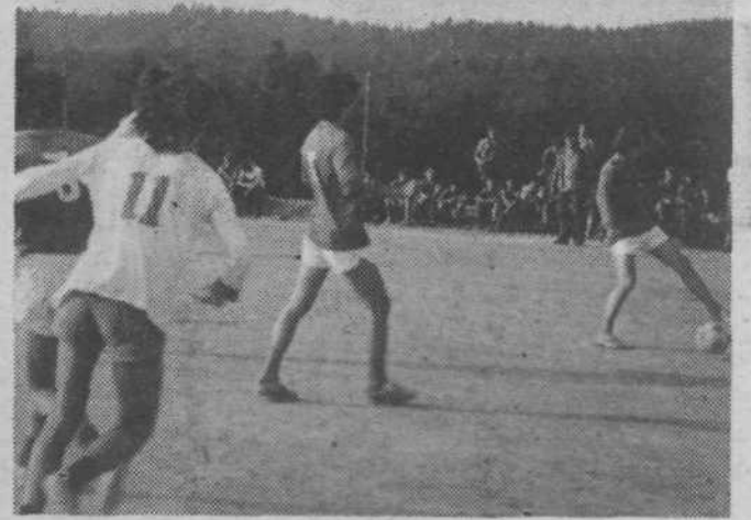
Tu smo najboljši