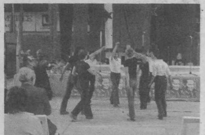
Tolikokrat pa seveda tudi proslavljamo