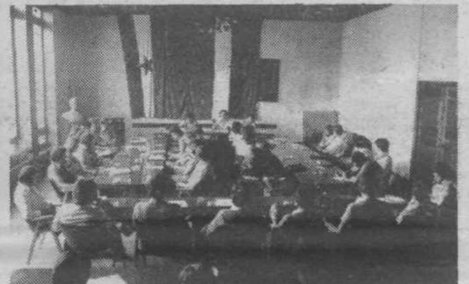
Tako smo se in se bomo dogovarjali