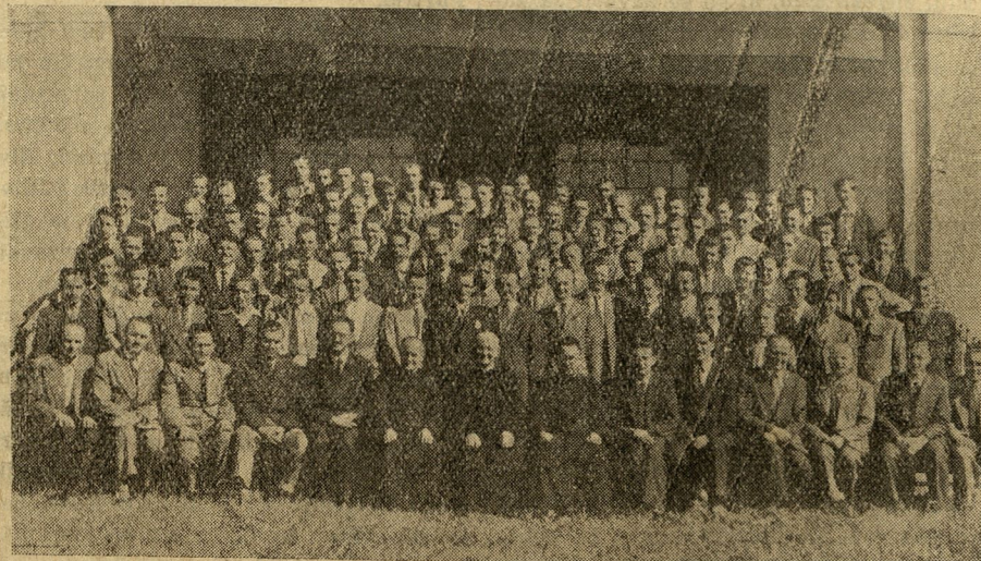
Tudi slovenski fantje so imeli duhovne vaje v zavodu Don Bosco v Ramos Mejia od 4.—6. februarja t. l. Na sliki udeleženci duhovnih vaj.