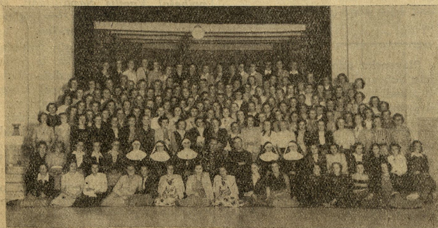
Udeleženke dekljskih duhovnih vaj od 2.—6. februarja t. l. v zavodu San Pablo de Vicente v Buenos Airesu.

Argentina bo to leto dobila iz Norveške 25.000 ton papirja.