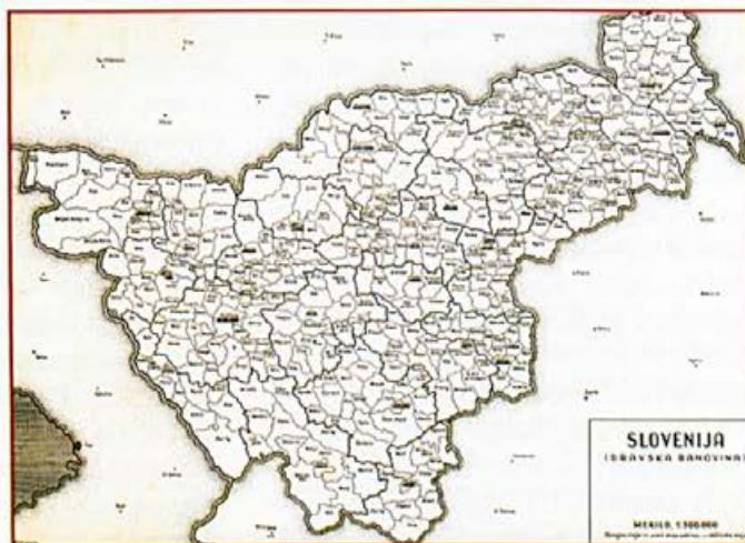
Na zemljevidu Dravske banovine (1940) je bila občina Kostanjevica del krškega okraja.

Z ustanovitvijo Kraljevine SHS (1. 12. 1918) in s sprejetjem Vidovdanske ustave 28. junija 1921 so bile ukinjene avstrijske dežele, ustanovljene so bile oblasti, Ljubljanska za Kranjsko, Mariborska za Štajersko. Nova oblast je v glavnem ohranila Avstro-Ogrske okraje. V letu 1921 je bilo na območju sedanje Slovenije, razen območja, ki je bilo med obema vojnoma v okviru Italije, 1073 občin. V okraj Krško (53136 prebivalcev) je bilo vključenih 20 občin, med