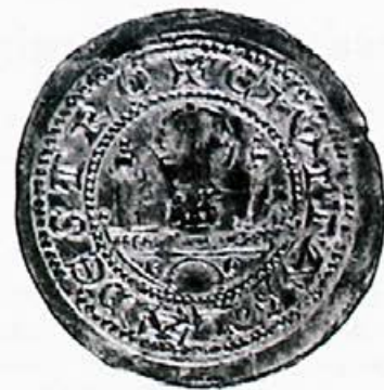
Novce iz kostanjeviške kovnice iz let 1205-1215 na katerem je naveden status Kostanjevica kot mesta - Civitas Landestro