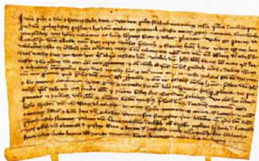
Listina datirana 6. oktobra 1291, nosi najstarejši ohranjen mestni pečat

stilnega preoblikovanja, ki pa kljub temu dosledno spoštuje herladične predpise.