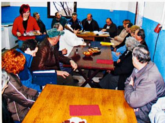
Zboir krajanov na Malencah

a) na voliščih , ki jih določi volilna komisija referendumskega območja, za območje katerega je volivec vpisan v volilni imenik, in sicer v nedeljo, 29. januarja 2006 od 7. do 19. ure;