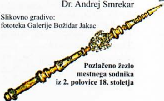
Pozlačeno žezlo mestnega sodnika iz 2. polovice 18. stoletja