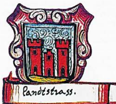
Grb mesta Kostanjevica J. W. Valvasorja iz velike grbovne knjige

Če se ozremo še dalj nazaj v zgodovino, vidimo daleč preko časa dejanske podelitve mestnih pravic.