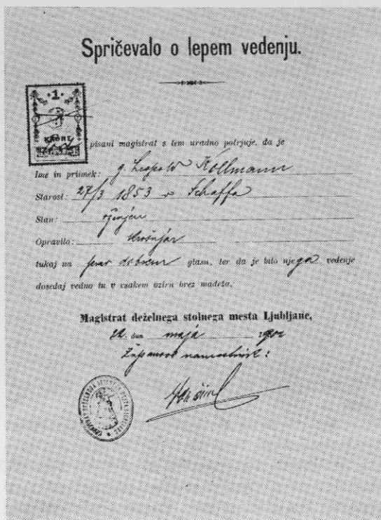
»Spričevalo o lepem vedenju«

Mesto pa je še vedno opravljalo tudi določena opravila krajevne policije. Podržavljajanje mestne policije sta omogočala tudi občinska reda 1887 in 1910, v katerih je zapisano, da: »... Iz višjih državnih ozirrov se smejo do-