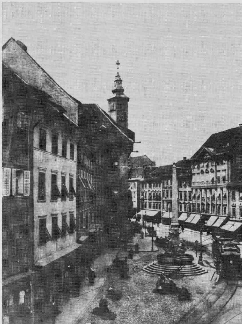
Ljubljanski magistrat okoli leta 1900

III. oddelek: okrajni načelniki (členi 54—57);