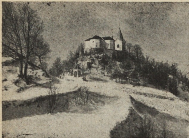
SV. GORA pri Litiji, znana božja pot