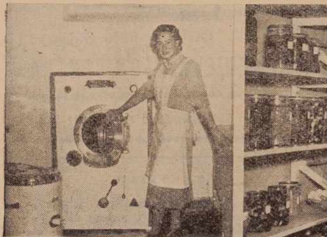
Zavodi za napredek gospodinjstva — važna vloga

Ob koncu svojega referata je govoril tov. Veršič tudi o skrbi in oblikah skrbi za stare ljudi in poudaril, da bodo stanovanjske skupnosti vsem tem potrebam najlaže zadostile.