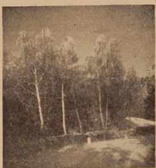
Gozd na Gorickem

kacij dodeljevali neposredno kmetijskim združenjem. Zagovorniki tega predloga so utemeljevali predvsem potrebo po krepitvi kmetijskih združenj tudi na tem področju, drugi pa