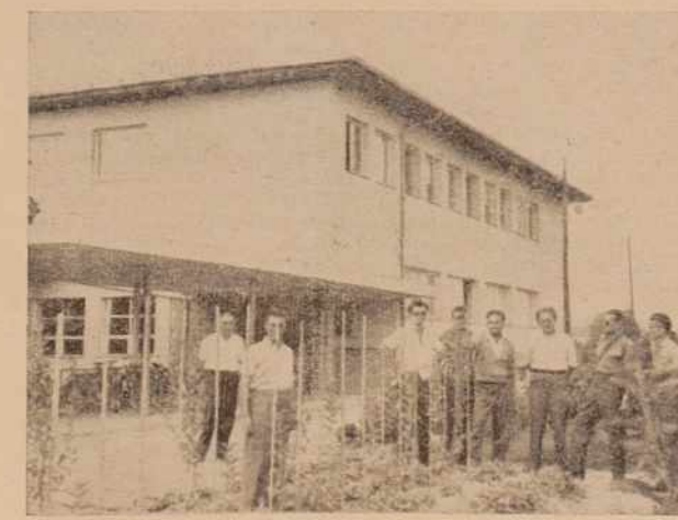
Razgovor pred sadjarskim inštitutom Skopje

tur posebej. Torej najprej iskanje ustreznih zemljišč z ugodnimi pridelovalnimi razmerami in šele potlej začetek velike pridelovalne akcije! V razmeroma kratkem času so nastali že po vsej Makedoniji trdni pri-