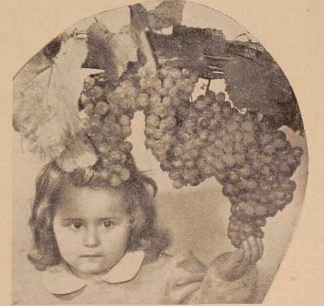
Iz jagod so curljale v sode sladke solzice...

Na splošno imajo dovolj naročil. Težave pa imajo pri transportu izdelkov, ki jih morajo prevažati v osem kilometrov oddaljeno Radgono na železniško postajo. Glede na to predvidevajo, da bi podjetje preselilo v doglednem času v Radgono, v Apačah pa bi bil manjši obrat tega podjetja.