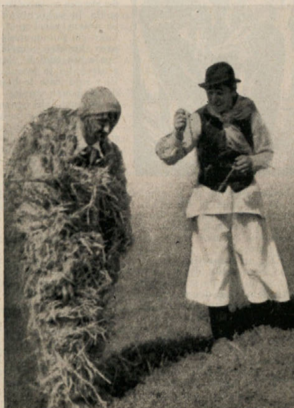
Rábolj, »zimski mož«, z gonjačem (Sv. Jurij ob Ščavnici)

Kdo pa prav ve, da imamo tudi Slovenci prav ime-