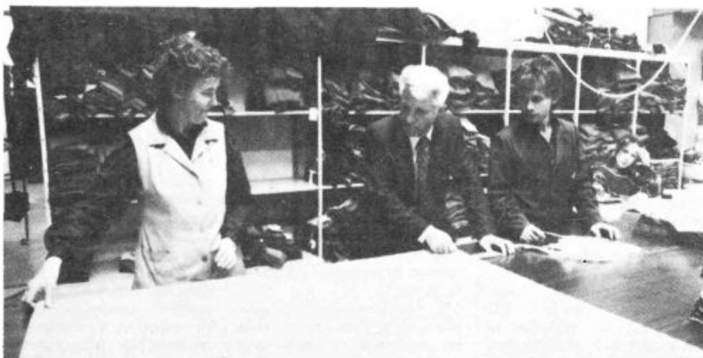
Vzdušje v PIKU vselej delavno