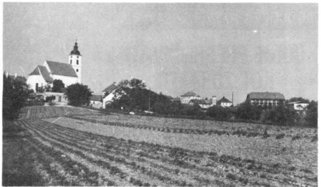
Pogled na krajevno središče