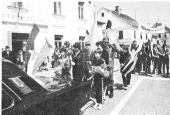
Mladi Lenarčani nosijo štafeto mladosti