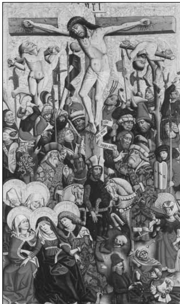
Sl. 4: Križanje, Hallstatt, župnijska cerkev (Schultes, 2002, 93).

V tabelni sliki iz Hallstatta iz Zgornje Avstrije iz srede 15. stoletja (1450–55) je slab razbojnik upodobljen povsem obrnjen, z glavo navzdol, kar je ena izmed značilnosti upodobitve v bavarskem in avstrijskem slikarstvu 15. stoletja. Križanje spremlja množica, ki je povsem zapolnila spodnji del podobe (Schultes, 2002, 93–94).