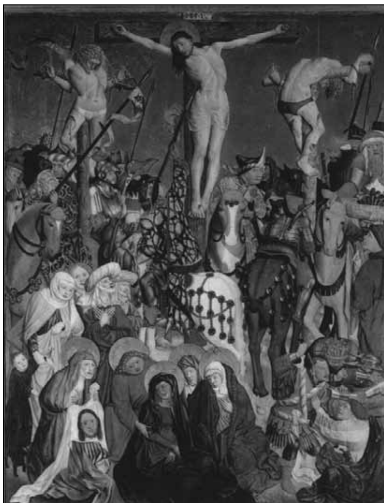
Sl. 6: Križanje, München, stolnica. Fig. 6: The Crucifixion, Munich, Cathedral.

ronike, in kjer so figure mnogo bolj stisnjene v celovito skupino s poudarjeno izokefalijo. Številni ekspresivni elementi v posameznih figurah in dinamika celote prav tako nakazujejo seznanjenost z bavarskim slikarstvom tega časa.