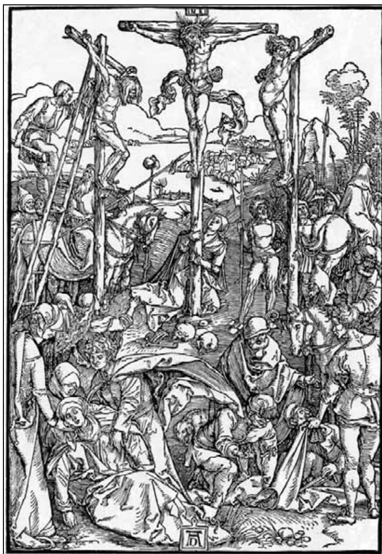
Sl. 1: Albrecht Dürer: "Malo križanje" (Schoch, Mende, Scherbaum, 2002, 119). Fig. 1: Albrecht Dürer: "The Little Passion" (Schoch, Mende, Scherbaum, 2002, 119).

Slika Križanje, ki je nastala okoli leta 1530 in je sedaj v Diecezanskem muzeju v Celovcu (Demus, 1991, 590; Höfler, 1998, 181–182), se tako v ikonografiji kot v kompoziciji zgleduje po Dürerjevem lesorezu, ki je bil zelo vpliven. Koroški slikar, ki je deloval v prvi tretjini 16. stoletja, je v svoji sliki prevzel tako motiv biriča na lestvi kot tudi druge elemente Dürerjevega lesoreza, denimo repousoir z vojakom na desni, skupino vojakov, ki kocka za Kristusov plašč, in delno skupino z Marijo in Janezom Evangelistom. 1