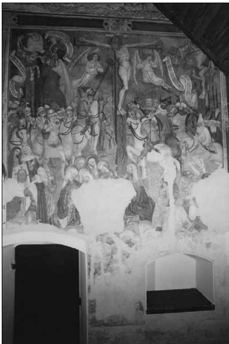
Sl. 5: Križanje, Dovje, cerkev Sv. Mihaela. Fig. 5: The Crucifixion, Dovje, St Michael's Church.

Zelo zanimiv primer tega ikonografskega tipa v Sloveniji, ki vsebuje množico stranskih oseb, pripovednih nadržnosti in naturalistične upodobitve obeh razbojnikov, je freska na zahodni steni cerkve sv. Mihaela na Dovju pri Mojstrani, ki je nastala okoli 1460. Gre za monumentalno upodobitev Križanja, ki obsega množico nadržnosti, posameznih skupin in oseb, torej za značilen primer mnogofiguralnega Križanja (Roth, 1967), ki