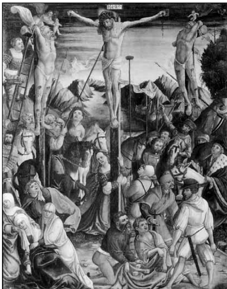
Sl. 2: Križanje, Škofijski muzej, Celovec (Höfler, 1998, 181).