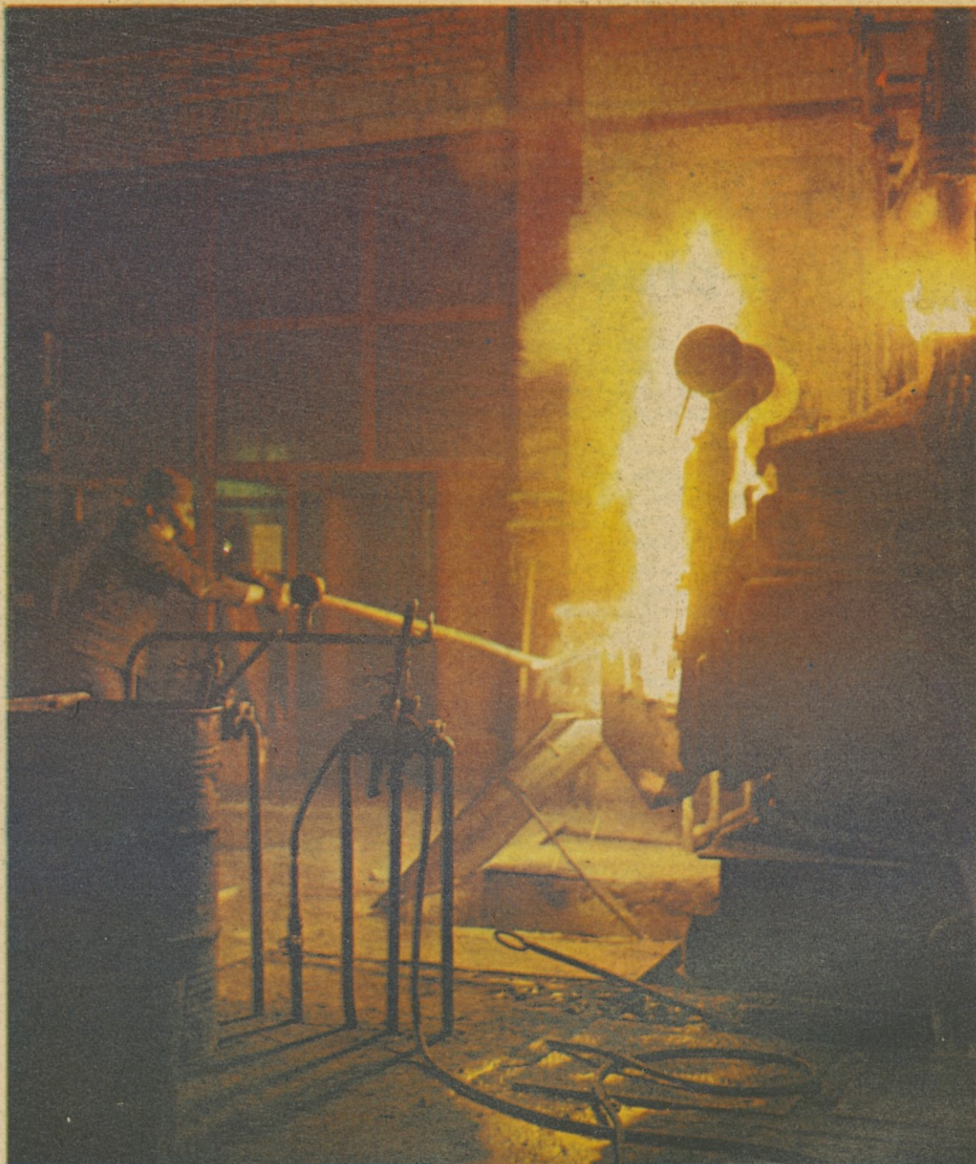
Ze od leta 1971 je kolektiv Mute v sestavi ZP Gorenje. Z drugimi delovnimi organizacijami ZP Gorenje planira Muta kompleten program kmetijske mehanizacije, vrtnega orodja in proizvodnjo odlitkov, o čemer smo se lahko prepričali na sejmu vzorcev „Gorenja“, ki je bil te dni v Velenju. Razstava dosežkov ZP Gorenje je bila tokrat prvič, postala pa bo tradicionalna. A. U.

PREDSEDSTVO RS ZSS O USTANAVLJANJU SVETOV POTROŠNIKOV