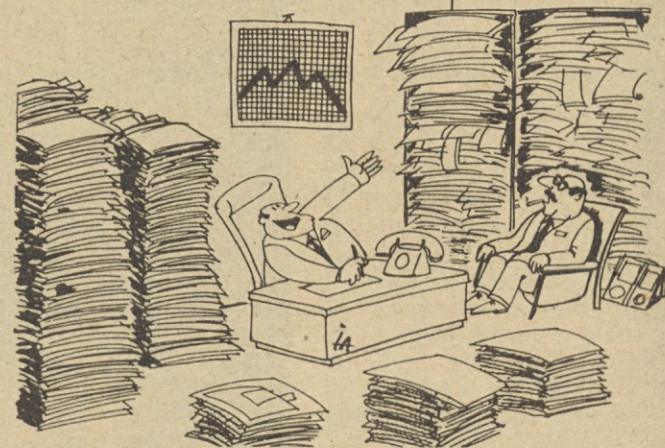
— Vidite, nas pomanjkanje premoega sploh ne skrbi. Kurili bomo z odvečnimi produkti naše administracije!