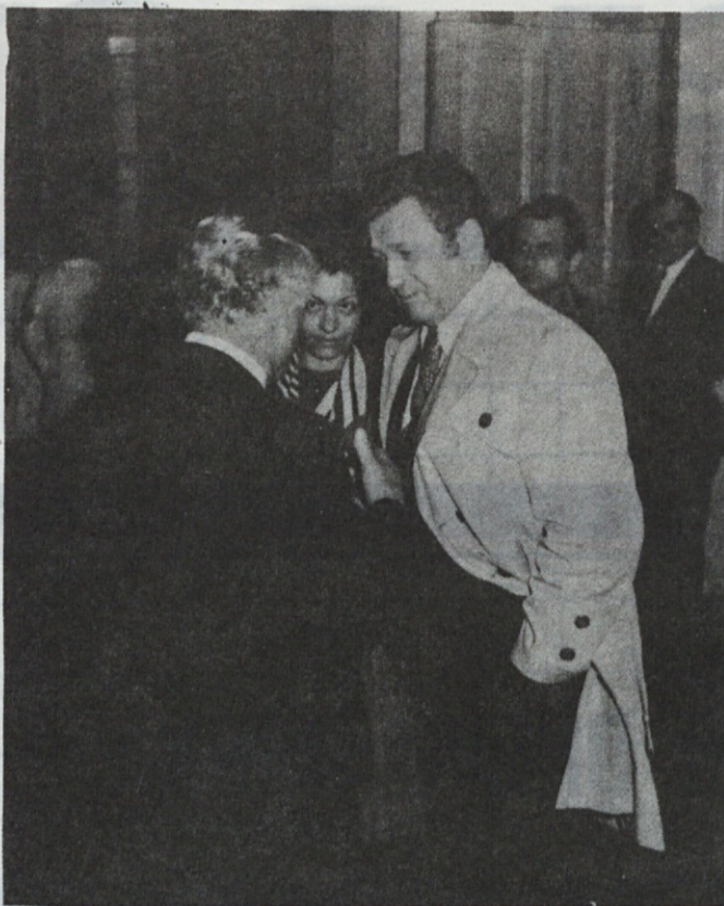
(Iz prve številke glasila — pred 10. leti)

Tudi na zapadu smatrajo da, če rečemo kar štrajki, niso neka izgubljena bitka, temveč so to kvečjemu le opozorilo, v kateri smeri je potrebno opraviti določene korekture za še nadaljno, vsekakor boljše pot.