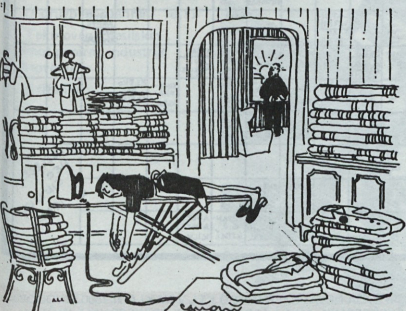
— Zena, ti sploh ne znaš biti več romantična. Zakaj tudi ti ne prideš pogledat čudovitega sončnega zatona?

Žrebanje nagradne križanke je bilo izvedeno 20. junija. Izmed 84