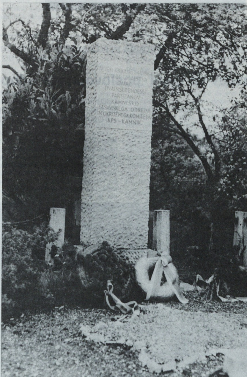
Spomenik padlim borcem na Oklem pri Domžalah