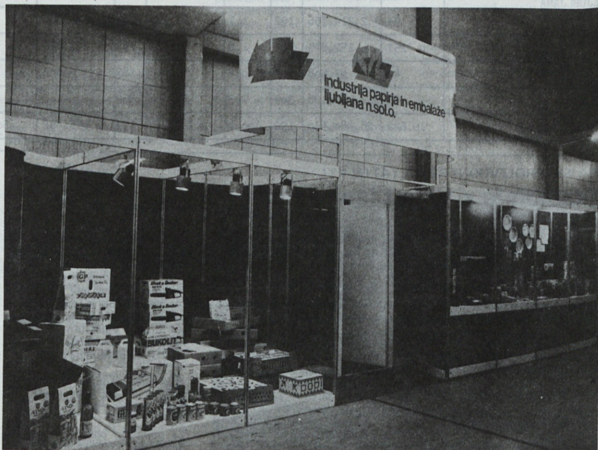
KTL na letošnjem velesejmu v Novem Sadu