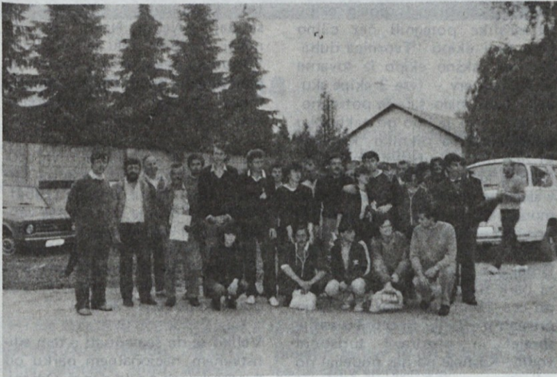
Del tekmovalcev DO KTL

— konferenca osnovnih organizacij sindikata DO KTL bo morala v bodoče v svojem letnem programu dela s konkretnimi zadolžitvami doseči, da bo naše nastopanje na teh tekmovanjih dejansko v ugled