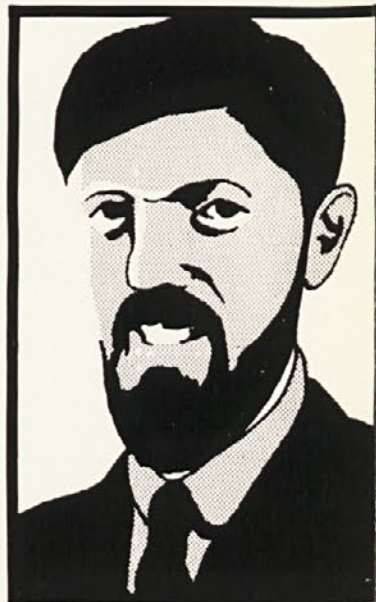
David Herbert Lawrence