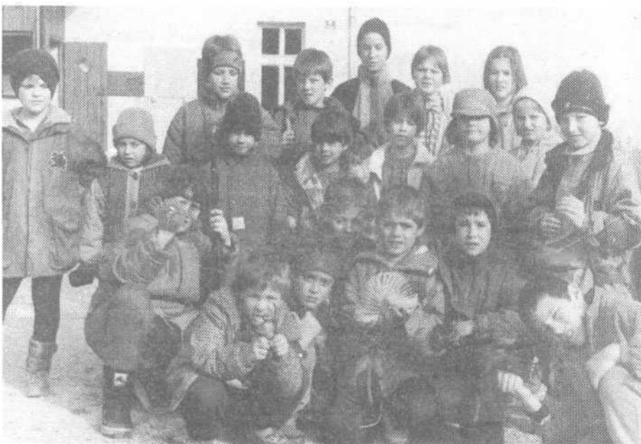
MED NAŠIMI OTROKI NA ZAPOTOKU