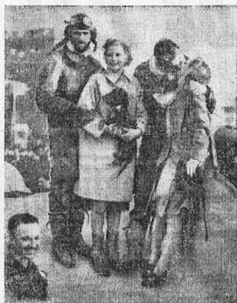
Srečno svidenje dveh angleških letalcev, ki sta na progi Anglija—Nova Zelandija—Anglija dosegla nov letalski rekord, ko sta to progo preletela v 10 dneh.