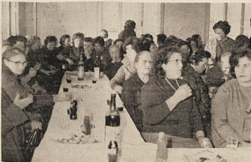
S sprejema žena na dolinskem županstvu

Tudi v goriški pokrajini je bilo več prireditov v počastitev 8. marca. V nedeljo popoldne je bila zelo uspešna prireditve v dvorani pri «Zlatem pajku» v Gorici, katere se (Nadaljevanje na zadnji strani)