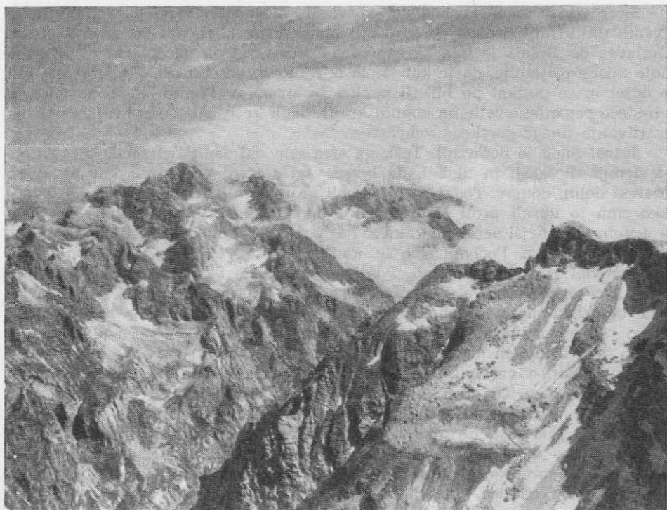
Skrlatica, ovenčana z velikimi snežišči 15. VII. 1960, s Kanjavca