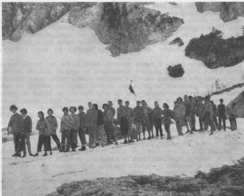
Mladina na plazinah v krnici Pod Srcem