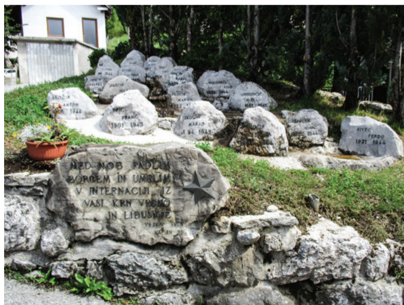
Obnovljen spomenik na Vrsnem

Tudi Livško ni brez spomenikov in plošč, ki so posvečeni NOB. Ko so obnavljali šolo na Livku, so s pročelja sneli ploščo, posvečeno izvolitvi prvega narodnoosvobodilnega odbora za Kobarški okraj. Dveletna prizadevanja naše borčevske organizacije za vrnitev plošče na staro mesto so le obrodila sadove, saj smo jo lani spet namestili na staro mesto. V bližini pa še čaka obnove spomenik padlim s tega območja. Vesel sem, da sem obiskal vsa spominska obeležja, nekatera obnovil in jih vnesel v Geopedijo. Lahko smo ponosni, da imamo v naši občini toliko spomenikov, obeležij in plošč. Vendar nekdo bo moral v prihodnje bolj poskrbeti, da obeležja ne bodo propadala, da se jih bo obnavljalo, čistilo njihovo okolico, skrbelo za dostope in oznake, da to ne bo samo skrb borčevske organizacije. Obeležja so del kulturne dediščine in občine bodo morale v proračunu za njihovo obnovo in urejanje v prihodnje zagotavljati denar. Mi člani krajevnih organizacij bomo tudi s prostovoljnimi delom dajali svoj prispevek k skrbi za spominska obeležja in se tako oddolžili tistim, ki so na njih napisani. Svoje delo s popisovanjem bom letos nadaljeval v občini Bovec in Tolmin in tako zabrisal belo liso Posočja na Geopediji.