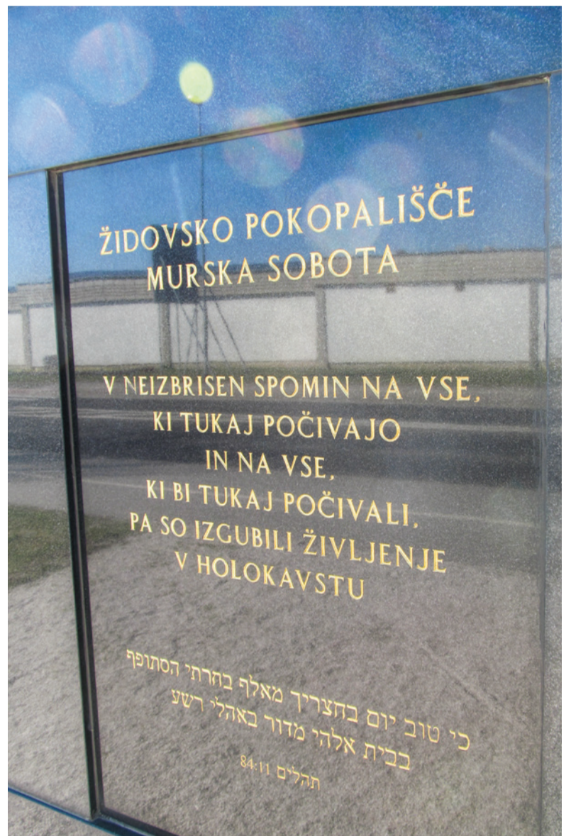
Obnovljeni spomenik na judovskem pokopališču v Murski Soboti