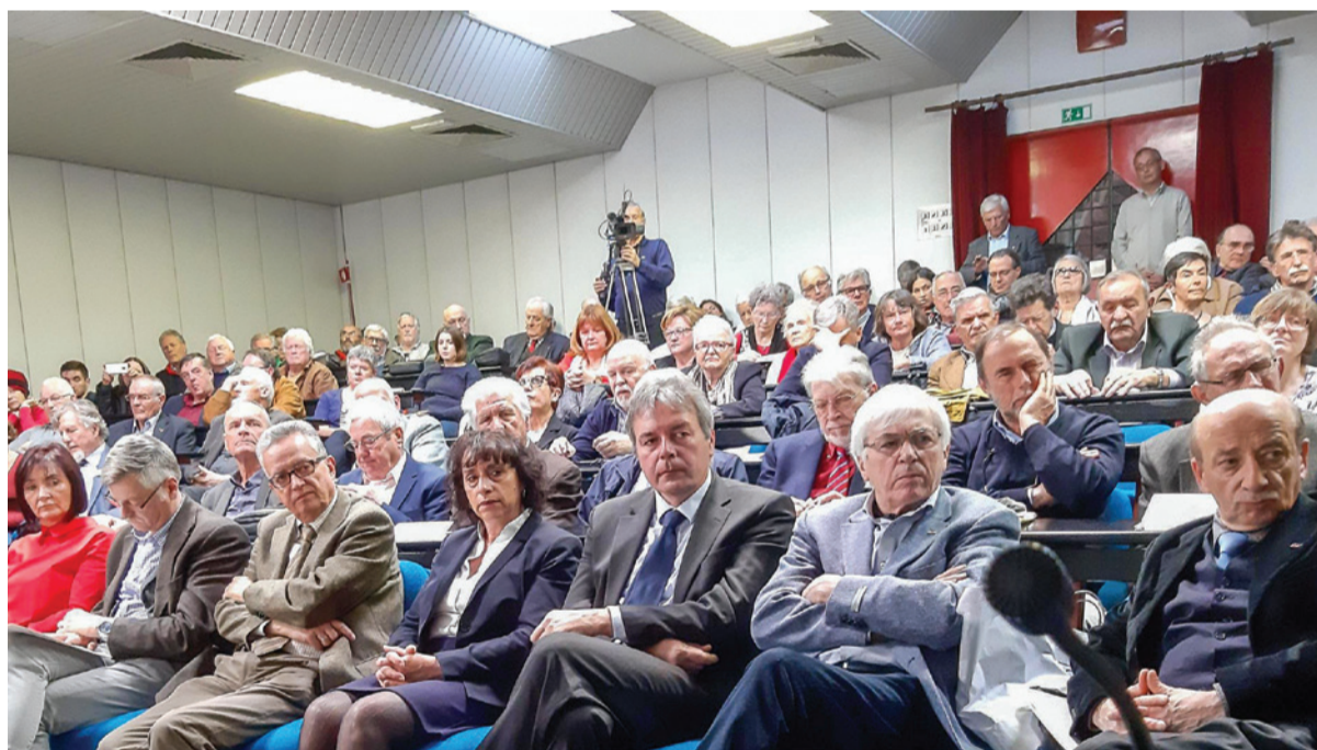
Srečanje protifašistov Avstrije, Italije, Hrvaške in Slovenije v Sežani.

Vendar še zdaleč ni jasno, ali je s tem prepovedano tudi maševanje nekega »navadnega« duhovnika ali kaplana. Zato borčevske organizacije iz Avstrije, Hrvaške, Italije in Slovenije skupno z združenjem Memorial Karnten in klubom slovenskih študentov in študentk v Celovcu pozivajo avstrijsko politiko, naj sledi oceni krške škofije, se zave svoje politične odgovornosti