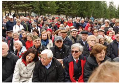
Spominska slovesnost na Javorovici

Tudi v današnjem času se dogajajo grde stvari. Pred nekaj leti, leta 2015, se je po šentjernejških gostil-