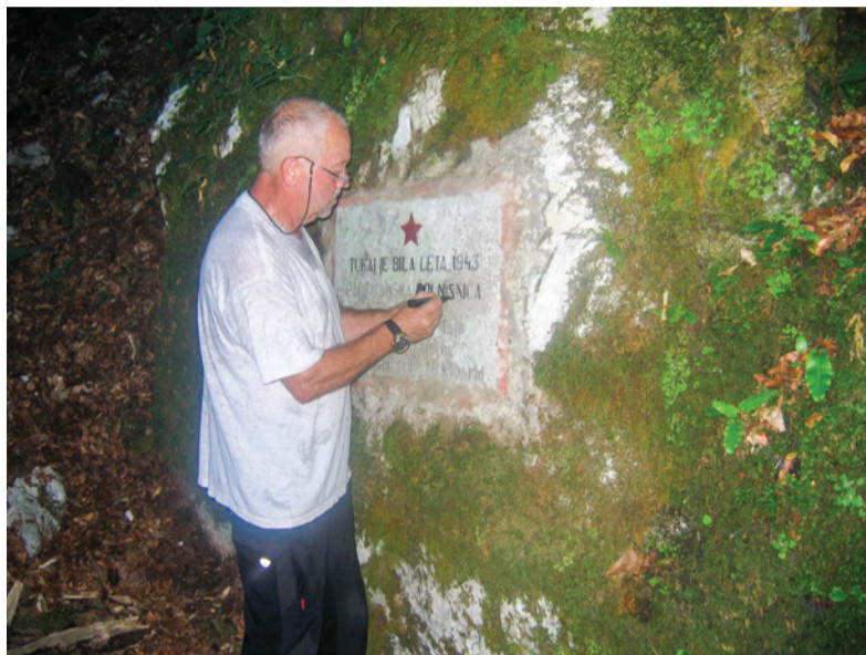
Obnova napisov pod Matajurjem

Cesta, ki pelje proti Livku, pa nosi ime Cesta Briško-beneškega odreda. Veliko težav sem imel, da sem našel ploščo nad planino Zapirkraj v Krnskem pogorju. Le s pomočjo domačina, ki je ravno takrat bil v bližini, sva našla kraj, kjer je pritrjena plošča. Med Krnom in Batognico na sedlu Škrbini stoji plošča, posvečena padlim borcem Gradnikove brigade julija leta 1943 in padlim Gregorčičeve brigade leta 1944. Že dvakrat so nepridipravi oskrunili