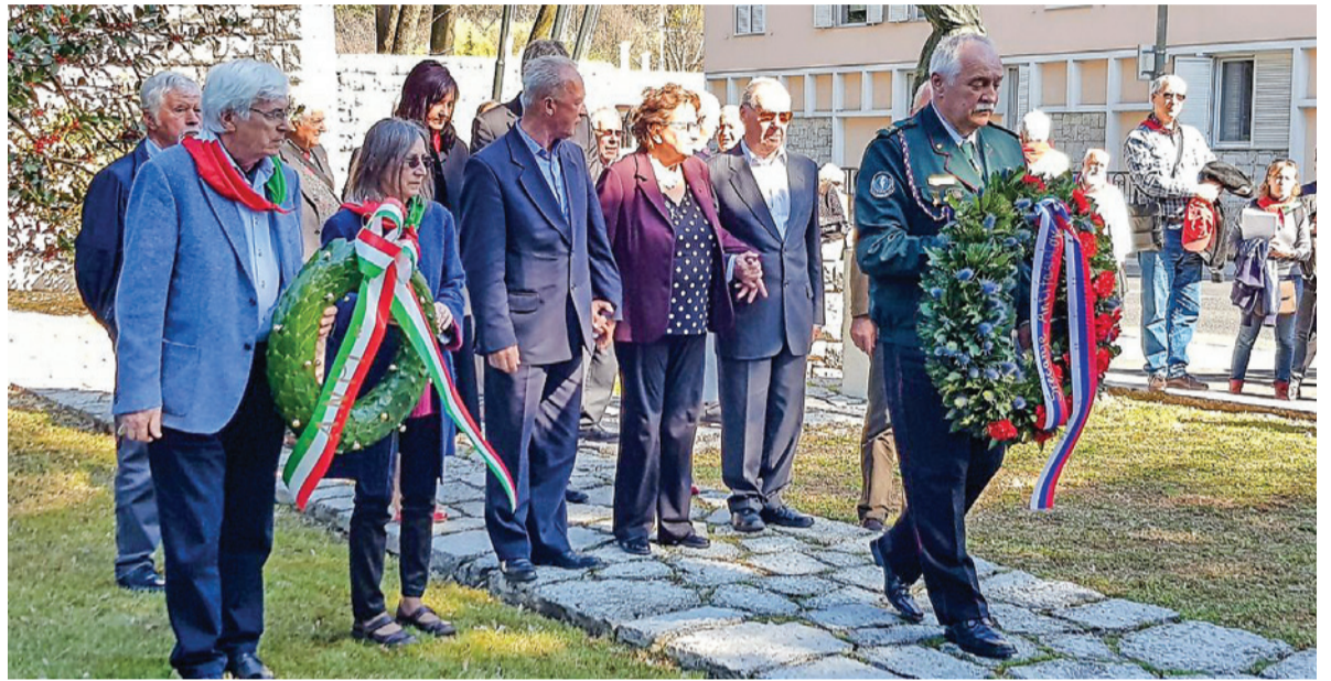
Udeleženci srečanja so položili vence k spomeniku padlih v mestnem parku.

Naslednje srečanje bo 4. maja na Madžarskem v Budimpešti in prepričani smo, da bomo s svojo energijo in pozitivnim odnosom do vrednot NOB in občečloveških vrednot prebudili čut v ljudeh, da je usoda Evrope, našega skupnega domovanja, tudi v njihovih rokah.