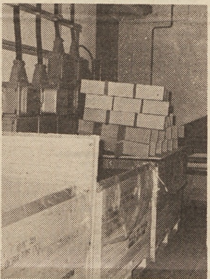
Iz TOZD Števcu: Zaman so napisu: Prepovedano odlaganje materiala pred električnimi razdelilci. Zakaj in do kdaj še tako?