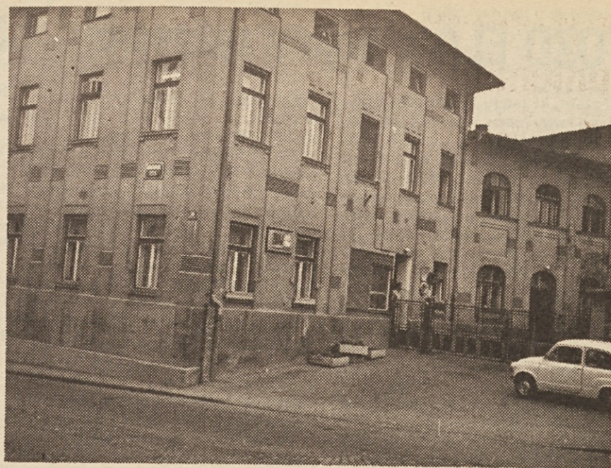
Stari tovarniški prostori TOZD Baterije Zmaj na Šmartinski cesti.

Novo v srednjeročnem programu je tudi enotnejše planiranje. Področje za plan, program in investicije bo ob enem s svojo analitsko – statistično službo služilo kot interna „banka