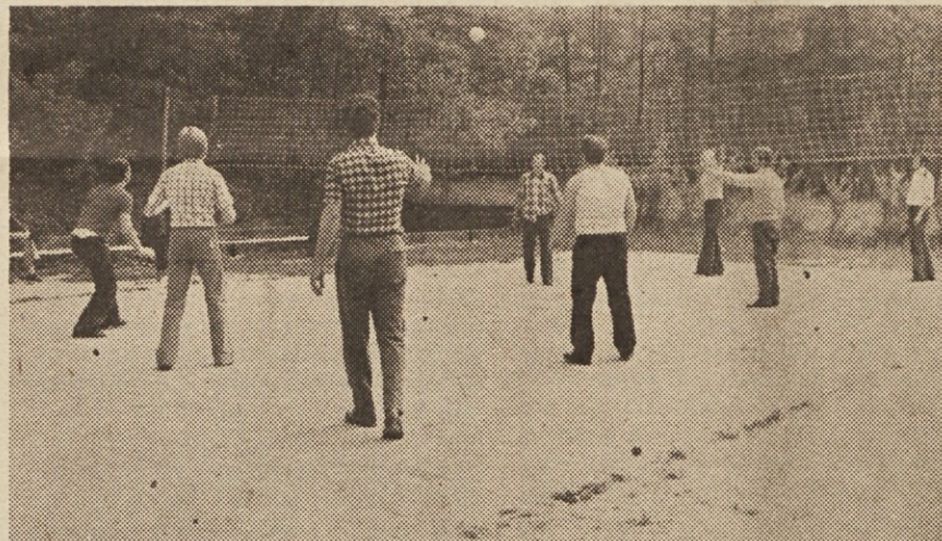
Na Pržanu med malico.