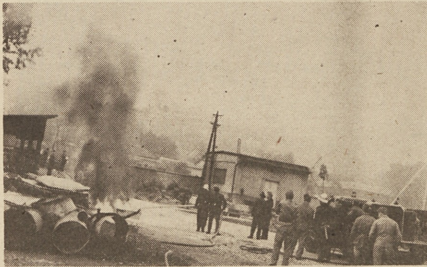
S kombinirane vaje Industrijskega gasilskega društva Elektromehanike in poklicnih gasilcev.