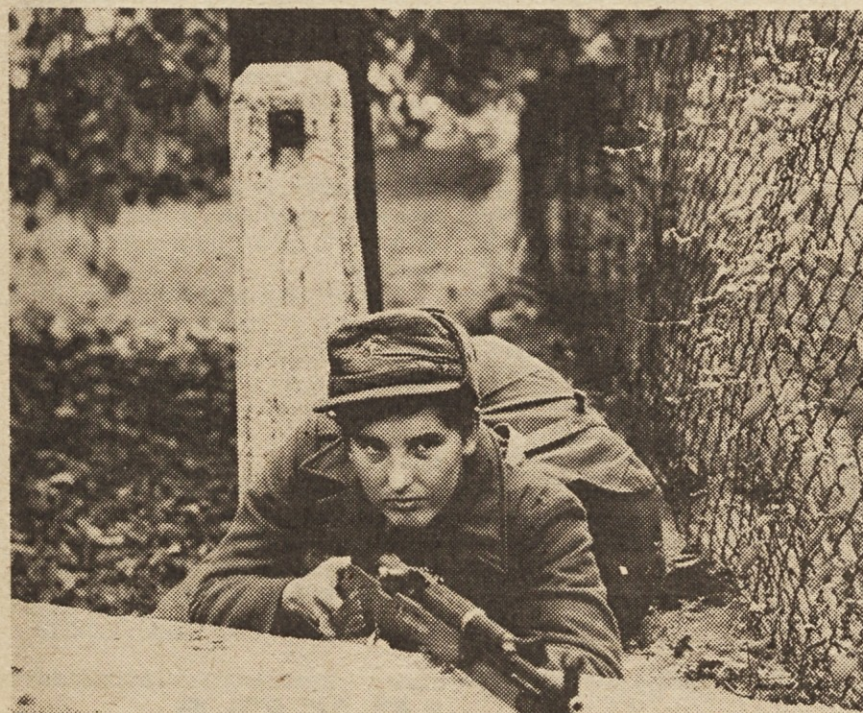
Pripadnica teritorialne obrambe „v akciji“.

Seveda pa nič koliko umetniških zakladov hrani že Otok sam. Prizadevanja arheologov in republiškega spomeniškega varstva so prav v novejšem času opozorila na dodatne zanimivosti. Otok cvetja, dolg le okrog 300 metrov in širok okoli 200 metrov spaja s kopnino le most, dolg 12 metrov.