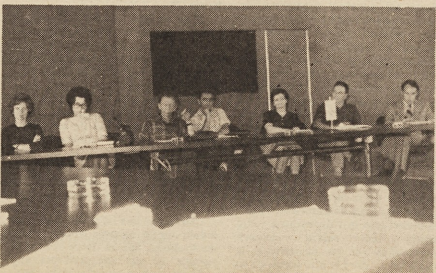
Med razpravo o srednjeročnem planu v IŠP.

Osebnih dohodkov v ZP se bodo večali hitreje od Široke potrošnje, vendar bo razkorak vse manjši in leta 1980