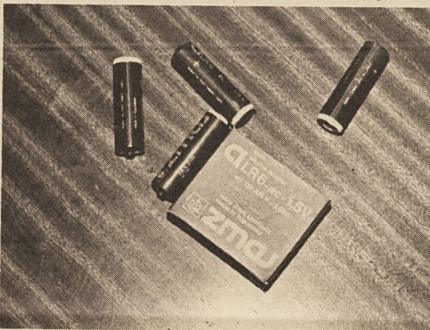
Najnovejši izdelek – 1,5 V alkalne baterije.

Tudi v tovarni baterij Zmaj te dni sestavljajo polletni obračun in ugotavljajo uspešnost svojega poslovanja. Prve ugotovitve, ki so že znane, kažejo, da so Zmaju v prvih šestih mesecih letošnjega leta dokaj dobro poslovali. Proizvedli so kar 15.300.000 kosov osnovnih potrošnih baterij in tako svojo proizvodnjo v primerjavi z enakim lanskim obdobjem povečali za 6%. Kljub temu pa ugotavljajo, da svojega polletnega plana še niso dosegli. Kje so vzroki za to? Baterije so artikel, ki se ga ne da proizvajati na zalogo, saj proizvodi ob predolgem ležanju v skladišču izgubijo na svoji vrednosti. Kot vemo, smo 1. aprila letos prešli na nov način plačevanja in pa spet na obračun po plačani realizaciji, kar vse je pripomoglo, da so finančni pokazatelji precej neugodni. V aprilu so v Zmaju plan prodaje izpolnili le 55%, prav tako pa pri obračunu pri plačani realizaciji izpade polovico junjskega priliva sredstev – to je okrog 4 milijone dinarjev, kar seveda povzroči negativni ostanek dohodka. Da pa bo slika jasnejša naj povemo, da imajo po fakturirani realizaciji v Zmaju kar 3,19 milijona dinarjev ostanka dohodka.