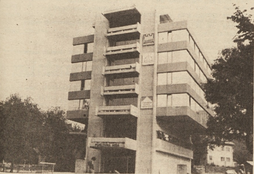
Poslovna hiša v Škofji Loki, v kateri je Iskra – Široka potrošnja.