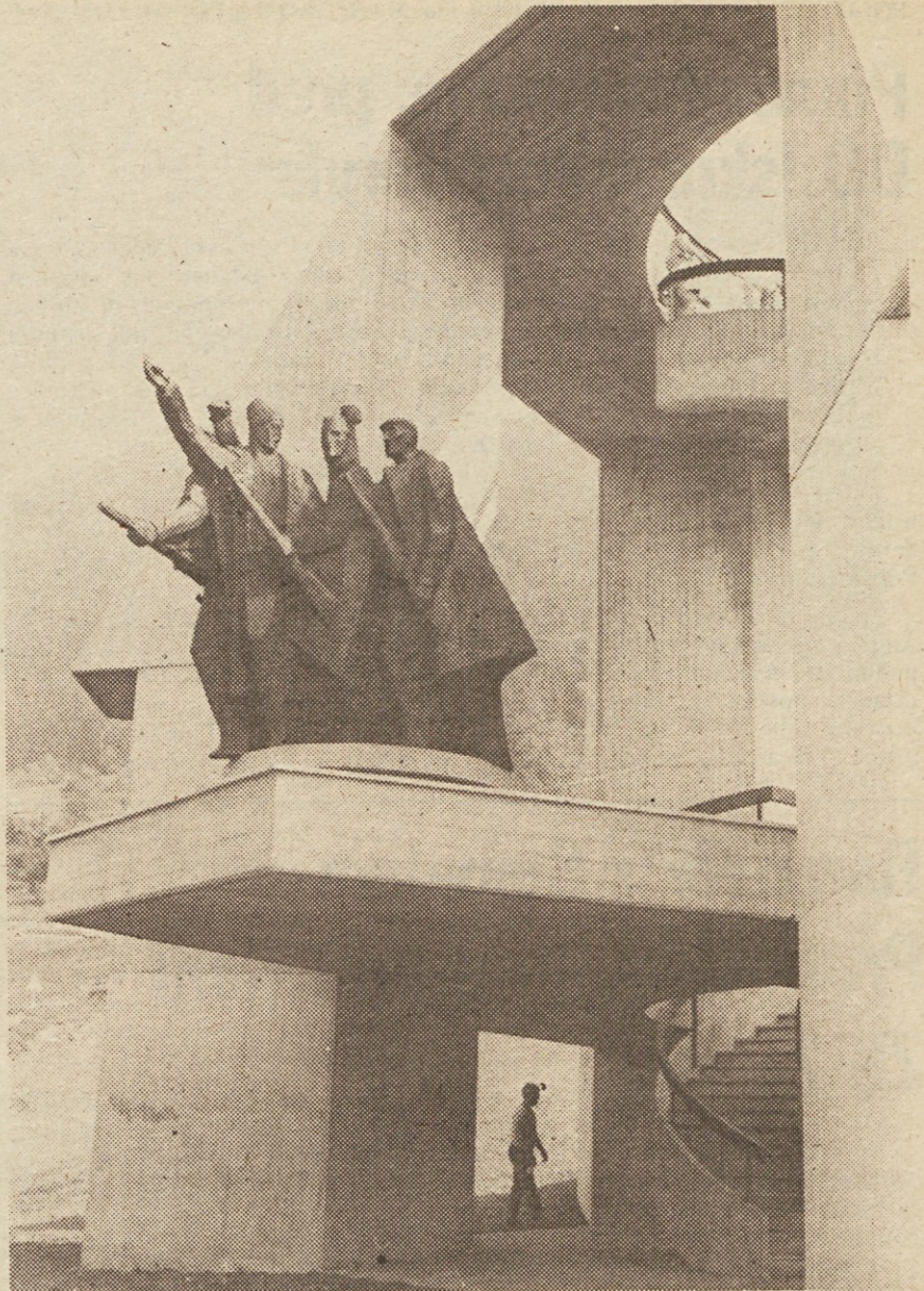
Detajl z veličastnega spomenika v Dražgošah.