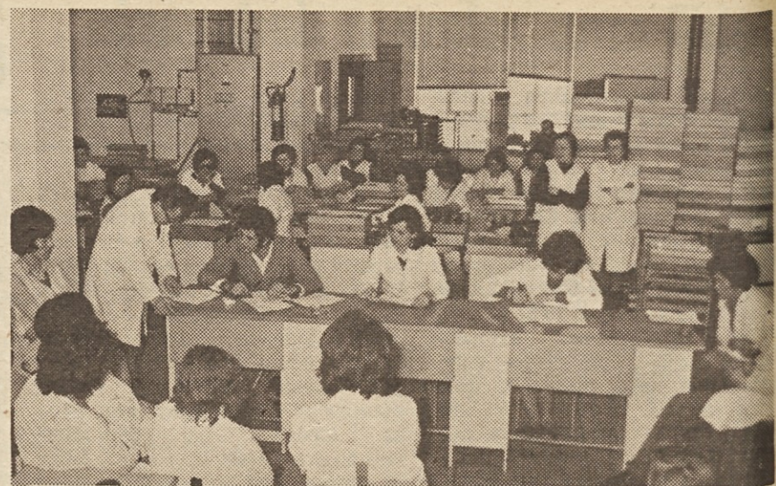
Brez cigaret bodo naši sestanki bolj učinkoviti. Dovolj mučno je nekadilcu sedeti na sejah, predavanjih, oz. kjer premnogi kadilci nenehno zadovoljujejo svojo razvado.

proti svoji volji tudi nekadilci. Iz teh in iz varnostnih razlogov je že prepovedano ali omejeno kajenje v javnem prometu, v določenih prostorih zdravstvenih, varstvenih in vzgojno-izobraževalnih organizacij, v dvoranah kulturnih ustanov in drugod.