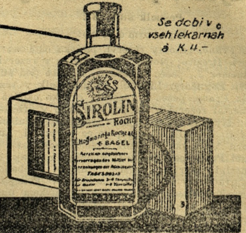
Se dobi v vseh lekarnah & K. U.