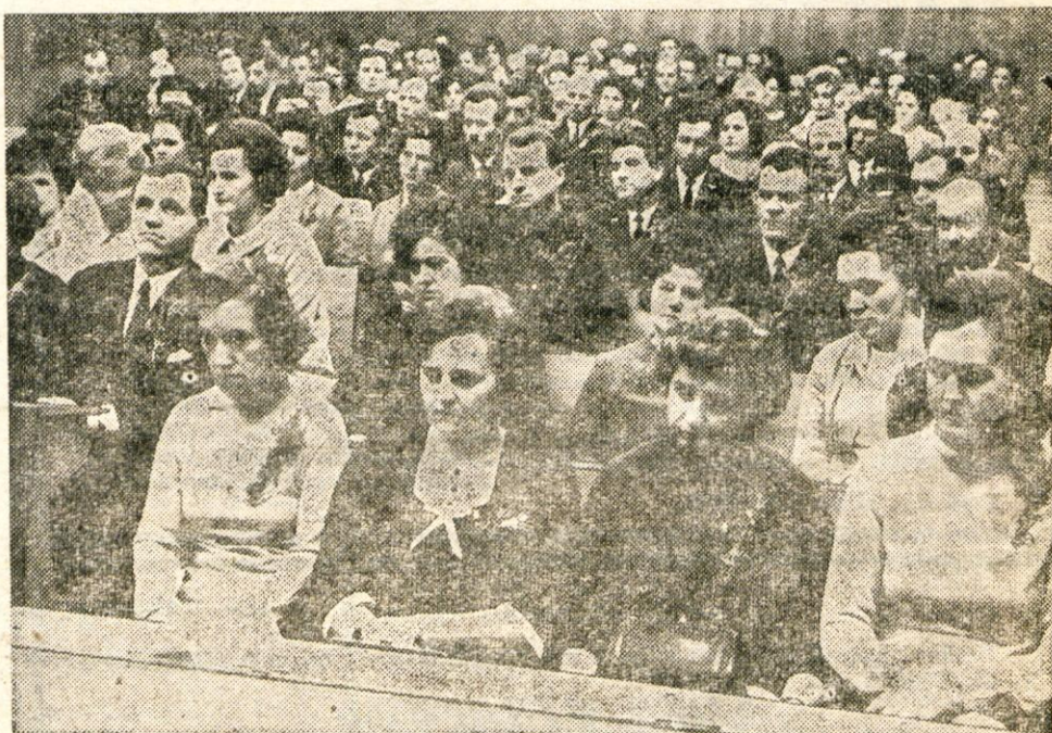
V petek, 27. decembra popoldne je bilo v prostorih kranjske občinske skupščine slavnostno zasedanje delavskega sveta tovarne elektrotehničnih in finomehaničnih izdelkov Iskra Kranj. Na seji so obdarili tudi vse člane kolektiva, ki že dvajset let delajo v tovarni.