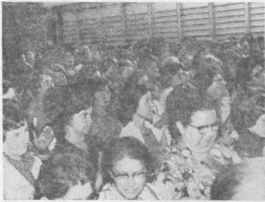
Prosvetni delavci so praznovali