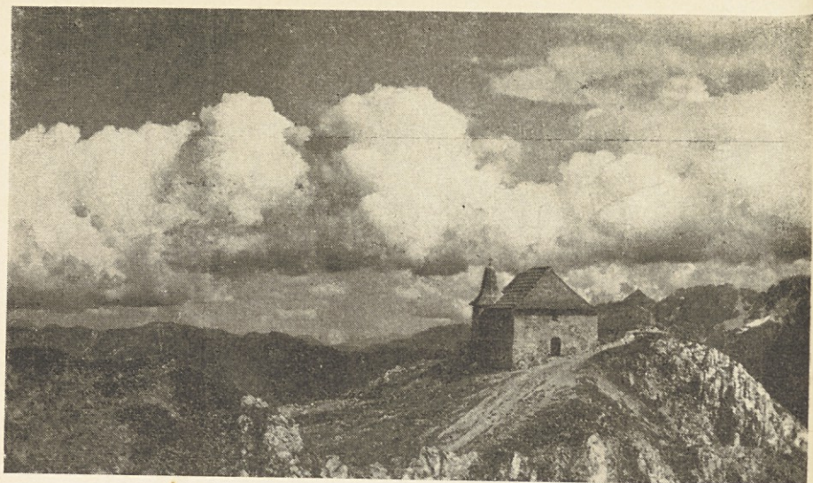
Zgoraj: Najvišje ležeča slovenska cerkev (Marija na Kamnu) stoji na Dobraču (2166 m), kjer se vrši vsako leto 25. julija in 25. avgusta služba božja; odtod je najveličastnejši razgled po ožji domovini našega škofa. — Spodaj: Pogled od Božjega groba proti Peci, pod katere vzhodjem je rojstni kraj Prezvzišent ga