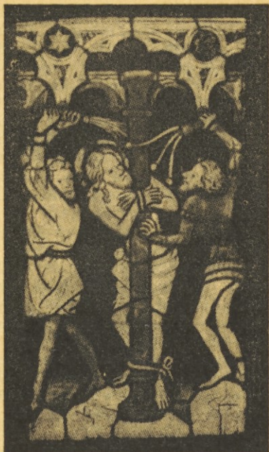
Eno izmed 60 oken v vetrinjski cerkvi. Dragocena umetnina je iz leta 1390

Brez dvoma je globoka skrivnost že v tem, da je Jezus ravno iz Petrovega čolna učil množice, kljub temu, da je bil