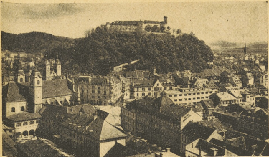
Ljubljana — prestolnica Slovenije in sedež ljubljanske škofije