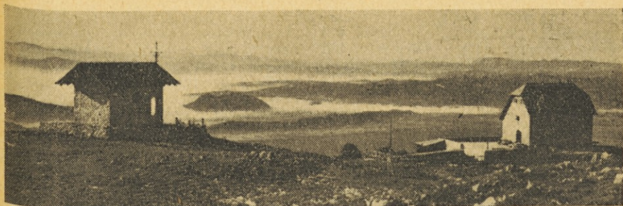
Marijino kapelico na Krvavcu (1700 m), ki stoji poleg planinske kočice, je 18. avgusta 1929 ob navzočnosti 2.000 vernikov blagoslovil velik Marijin častilec in ljubitelj naših gora, škof dr. Gregorij Rožman. Kapelica je bila zgrajena po načrtu mojstra Plečnika. Na sliki vidimo kapelico in kočico z razgledom proti Šmarni gori

nosti bi bile, da jih naženejo bolne domov. Drugače je pa tam, kjer ljudje toliko ne zavisijo od države. Ljudje so prišli do spoznanja, da je resnica v tem, kar država najbolj prepoveduje in preganja. Bolj ko se zaletava v Cerkev in duhovnike, bolj jih ljudje spoštujejo in poslušajo. Tako Tito po svoje pomaga, da se cerkve polnijo.