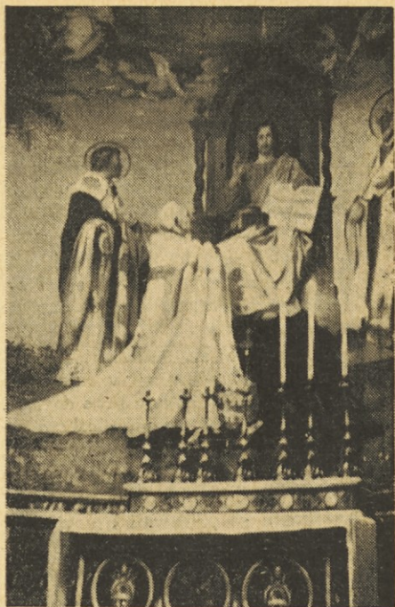
Kapela sv. Cirila in Metoda v cerkvi sv. Klemena v Rimu

Konstantin nato v dolgi izpovedi vere pravi med drugim: „...obljubljam torej in zagotavljam Vam, prečastitemu gospodu mojemu in papežu, in po Vas