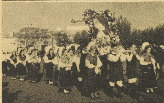
Veličastna procesija Slovencev v Argentini ob priložnosti II. slovenskega marijanskega kongresa. Zgoraj: del duhovščine; spodaj: fantje in dekleta v narodnih nošah s podobo brezjanske Marije Pomagaj