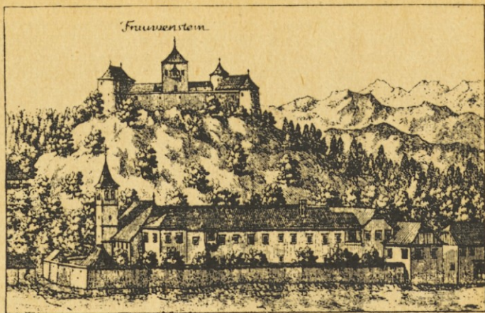
Velesovo in grad Kamen v Valvasorjevi dobi.

njena, da je bila oglavnica, s katero je bila pokrita in ki je padala ob prsih, prenařena v lase. Nadaljna sprememba prvotne oblike je odstranitev naslanjala Marijinega prestola; to naslanjalo so odstranili, ko so pričeli kip oblačiti v dragocena oblačila, pri čemer jim je bilo naslanjalo na poti; to se je zgodilo okoli leta 1670.