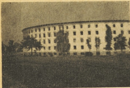
Baragovo semenišče v Ljubljani

tudi smeli biti do njega tako neprisiljeno domači, se je zasmejal in pritrdil, da bo isti kot sedaj. Sam pač takrat še gotovo ni resno mislil ali si želel doseči to do-stojanstvo.