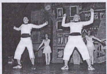
Plesna skupina Metulj Piran