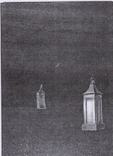
Na sliki: Piranska svetilnika, kombinirana vodna tehnika 73x102 cm (reprodukcija)

V začetku minulega leta so župani Občine Piran, Mestne občine Ptuj in Občine Škofja Loka podpisali skupno pismo o nameri za ustanovitev Nacionalnega združenja zgodovinskih mest Slovenije.