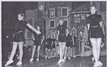
Mažoretna skupina Morje