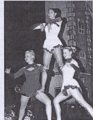
Plesno akrobatska skupina Flip