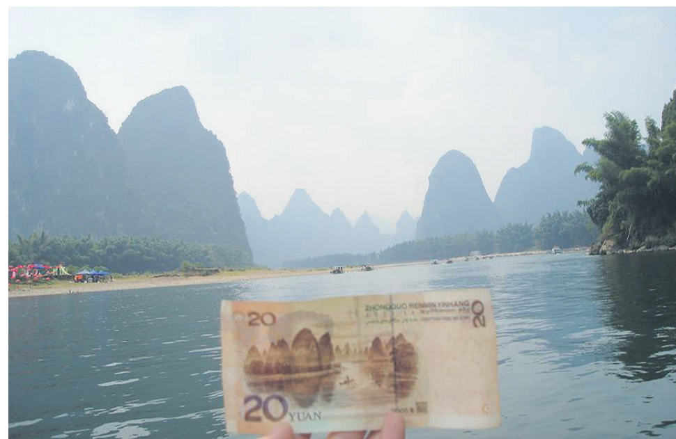
Na kitajskih bankovcih so odtisi znamenitosti. Lahko torej tudi potujete tja, kjer je okolje videti kot na denarju. Na fotografiji so hribi Guilina v avtonomni pokrajini Guangxi.

Podlistek z zgodbami s Kitajske pripravlja Polzelan Peter Zupanc, poznavalec filma, čigar prispevke lahko berete v prilogi TV-Okno, sicer pa je izdal dva romana in napisal oziroma sodeloval pri pisanju nekaj scenarijev. Drugi dom je pred leti našel v daljni vzhodni deželi. Njegove prispevke boste lahko brali vsak tretji četrtek v mesecu.