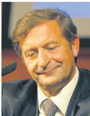
Karl Erjavec, DeSUS:

mreč za vso Slovenijo, ne le za moje volilno okolje, izjemnega pomena. Pravosodje namreč ne deluje oziroma deluje po sistemu, kakršen je bil pred letom 1990, mi pa moramo priti do pravosodja, kakršno je v Evropi. Moje glavno angažiranje bo tudi na področju človekovih pravic in podobnih tem.«