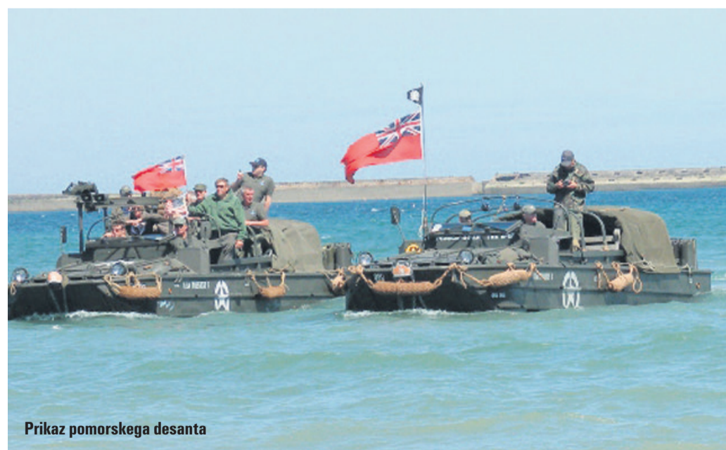
Prikaz pomorskega desanta