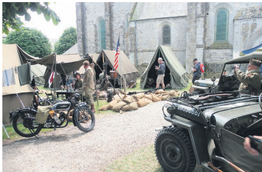
Eden izmed normandijskih kampov