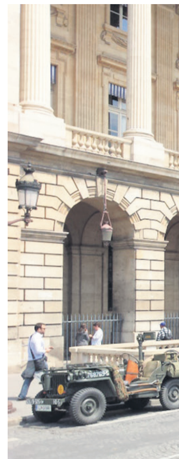
Naš konvoj v Parizu na Place de la C