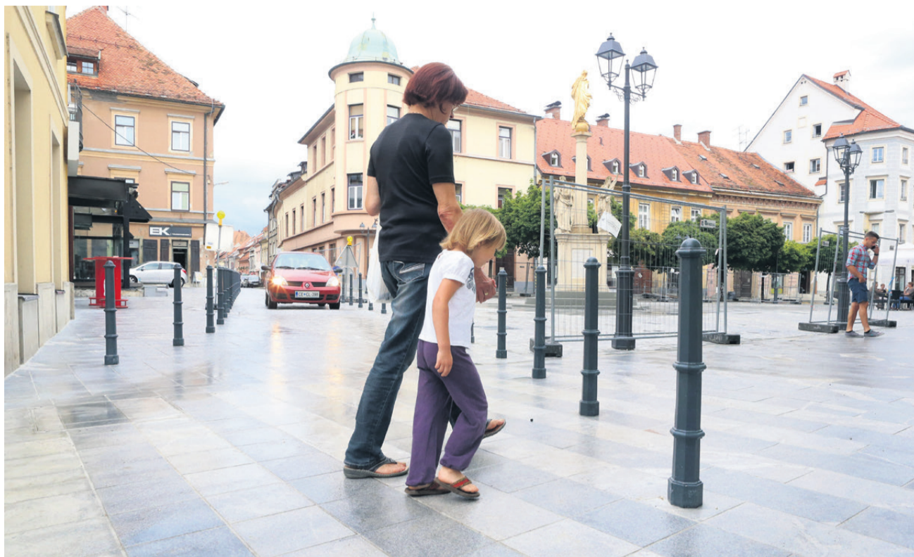
Prečkanje Gosposke ulice je še zlasti nevarno in nepregledno iz smeri Slomškovega trga na Glavni trg. Prav zaradi tega, da bi čim bolj obvarovali učence glasbene šole, so se v Celju tudi odločili za višjo hitrostno oviro ter dodatno omejitev hitrosti prometa na območju mimo Glavnega trga.