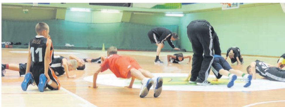
Vsako jutro so po zajtrku otrokom nazorno predstavili vaje in tehnike, ki so jih nato izvajali tisti dan.