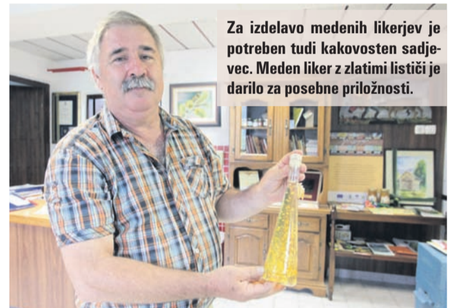
Za izdelavo medenih likerjev je potreben tudi kakovosten sadjevec. Meden liker z zlatimi lističi je darilo za posebne priložnosti.