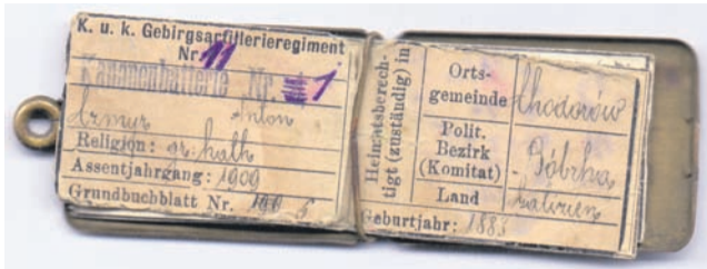
Izkaznica o pripadnosti Gorskemu topniškemu polku