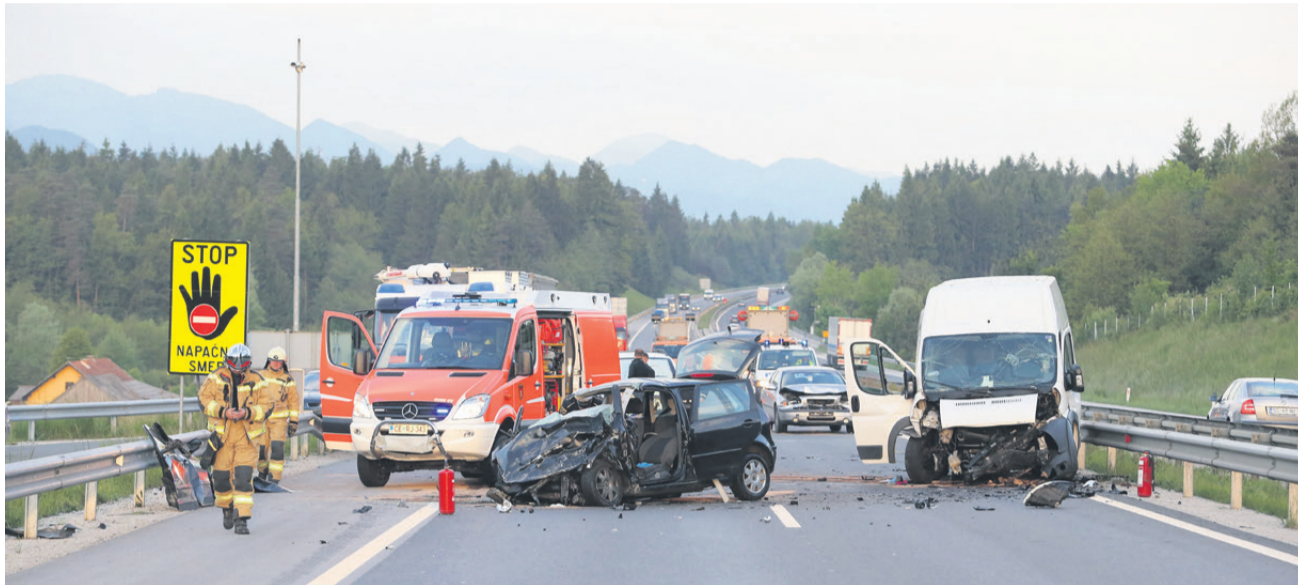
Takšna prometna nesreča lahko povzroči zastoje na avtocesti vsaj za nekaj ur.