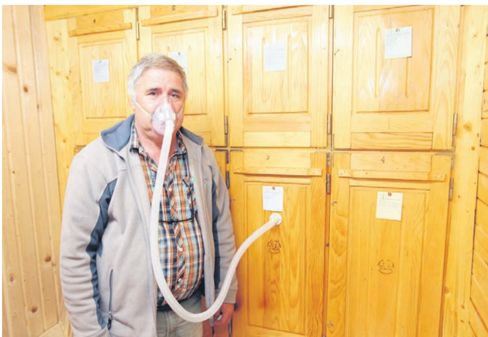
Vdihovanje zraka iz panja naj bi blažilo nevšečnosti pri pljučnih boleznih. Apiterapija je v Sloveniji še dokaj nerazvita.