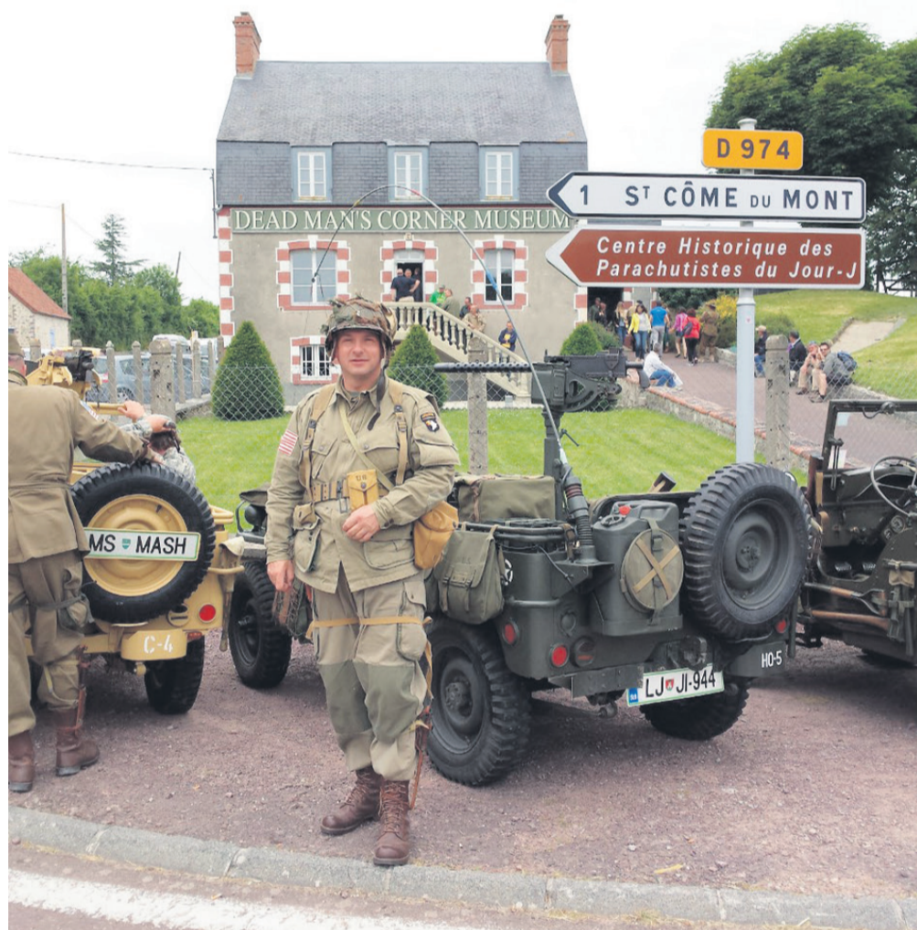
Pred muzejem Dead Man's Corner