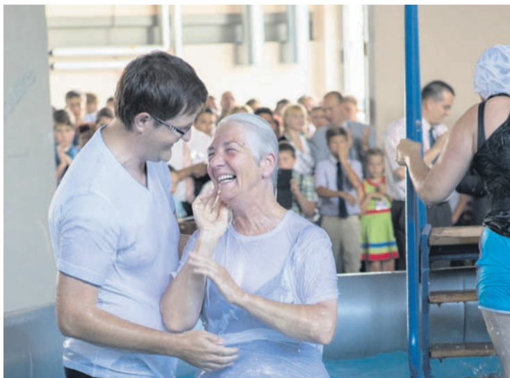
Po opravljenem krstu na celjskem Golovcu