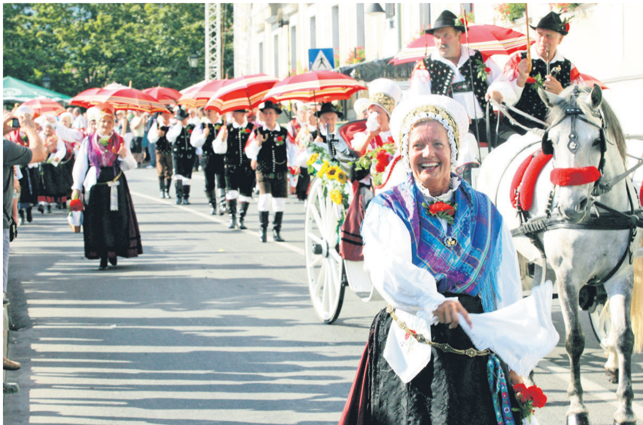
V Laškem bo v teh dneh znova živahno.