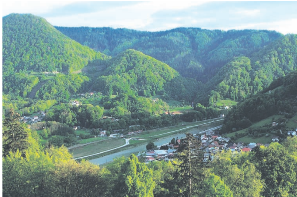
Panorama celjskega mestnega gozda v Pečovniku

Prihodnjik: Kako je Celje v srednjem veku pridobilo svoj gozd