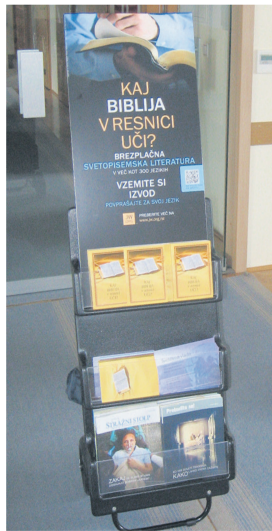
Oznanjevanje. Pred nekaj meseci so Jehovove priče nabavile voziček za nudenje verske literature, ki ga postavljajo na celjski železniški postaji.

BRANE JERANKO