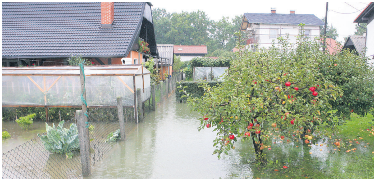
Prizor, zaradi kakršnih se ljudje v Gajih bojijo naraslih voda.