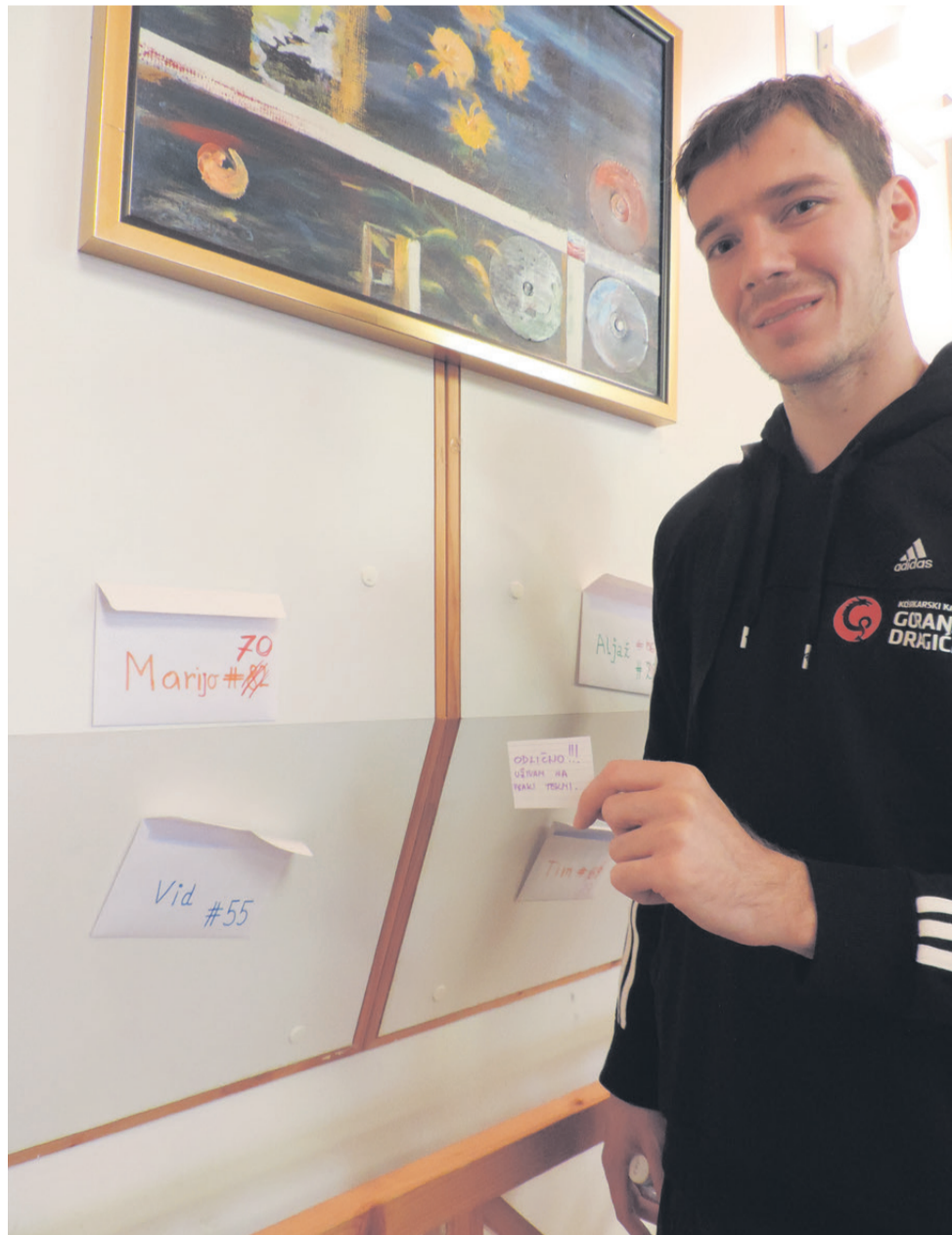
Mladi košarkarski upi so imeli ves teden na steni vsak svojo kuverto s svojim imenom, v katero so odlagali vprašanja in sporočila Goranu Dragiću, ki je nanj tudi pridno odgovarjal, hkrati pa so prejeli tudi pohvale svojih trenerjev in vzgojiteljev.