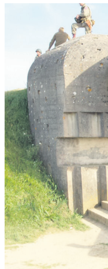
Bunker pri Longues-sur-Mer