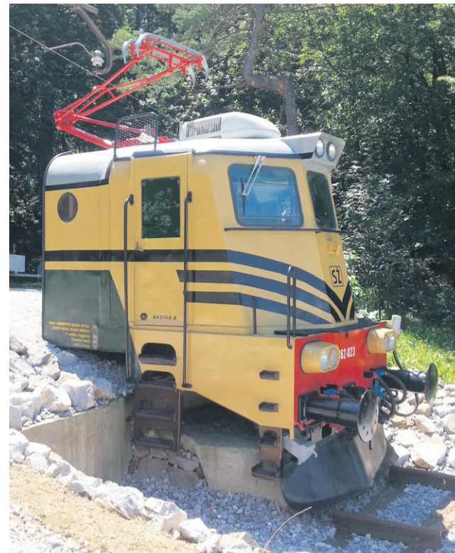
Obnovljeno lokomotivo, imenovano Meh, si je mogoče v železniškem parku v Mestnem Vrhu pri Ptujju ogledati vsako prvo nedeljo v mesecu.

Lokomotivo si je mogoče ogledati v železniškem parku v Mestnem Vrhu pri Ptujju vsako prvo nedeljo v mesecu. Vse njihove moči so zdaj usmerjene v izdelavo simulatorja, s pomočjo katerega se bo posamezniku v kabini prikazovala virtualna proga in predvajal pravi zvok sopihanja vlaka. Obiskovalci bodo tako imeli občutek, kot da stojijo v povsem pravi lokomotivi in opravljajo delo strojevodje.