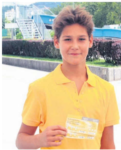
Nasmeh ob željeni nagradi – vstopnici za bazen za zmagovalca v košarkarskem izzivu.

Za vse željne zabave in nagrad je minulo soboto poskrbela animacijska ekipa Novega tednika in Radia Celje. Igre ob vodi in v njej ter športne aktivnosti so krajšale čas obiskovalcem celjskega letnega kopališča. Vmes se je našel čas za listanje Novega tednika, ki smo ga razdelili med obiskovalce.