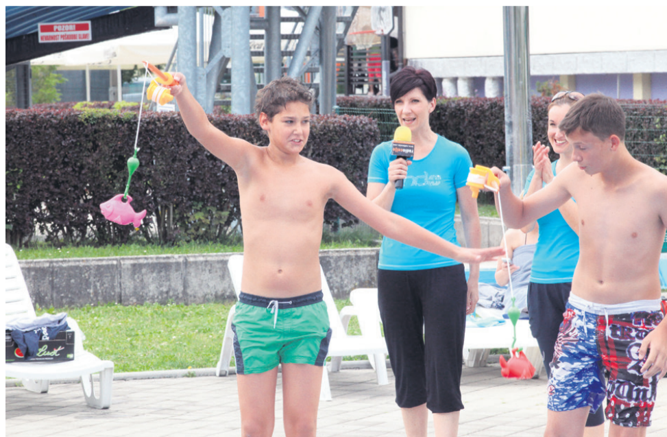
Znate loviti ribe v bazenu? Mlada ribiča sta dokazala, da gre, le čas je določil zmagovalca.