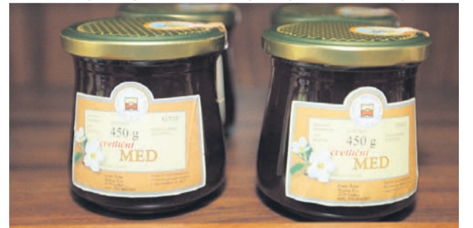
Šolarjev med je od lani označen s prav posebno nalepko. Pridobila sta namreč pravico do uporabe nalepke za geografsko označbo. To pomeni, da imata pravico proizvajati in dajati v promet blago, zavarovano z geografsko označbo za slovenski med.