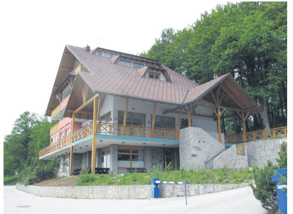
Almin dom na Svetini, doslej neuresničeni turistični up Občine Štore