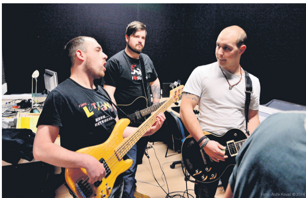
Zasedba Big Addiction na snemanju