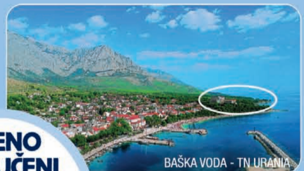
BAŠKA VODA - TN URANIA

MAKARSKA RIVIERA: Makarska riviera se razprostira na 60 km dolgem pasu pod gorovjem Biokovo, od Brele do Gradca. Za te kraje so značilne čudovite prodnate plaže, izredno ugodna klima, borovi gozdički, ki se malone dotikajo gladine kristalno čistega morja, ter slikovita manjša naselja in mesta, ki se stiskajo pod Biokovim. Ena za drugim so nanizana turistična središča Makarske riviere: Brela, Baška Voda, Makarska, Tučepi, Podgora, Živogošče, Igrane, Gradac. Baška Voda je priljubljeno letovišče, znano po čudoviti prodnati plaži in romantični promenadi pod borovci.