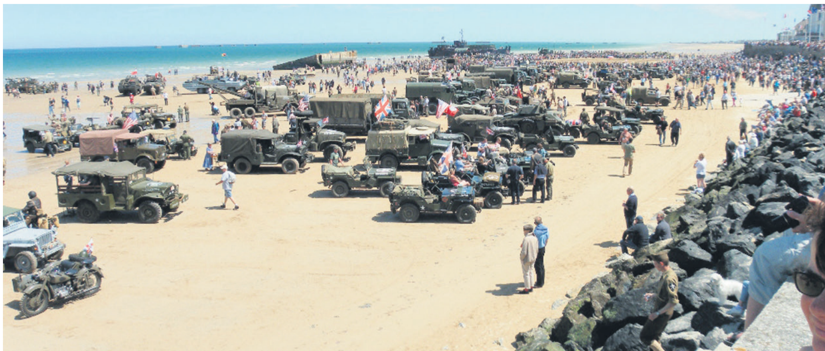
Vojaška vozila na obali