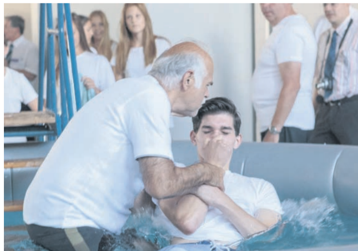
Krščenca potopijo v vodo. Na letnem zborovanju slovenskih Jehovovih prič, ki je bilo v Celju, so krstili trinajst novih vernikov.