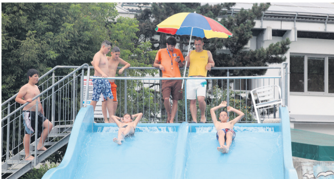
Katera tehnika je boljša, da si najhitrejši na drči?