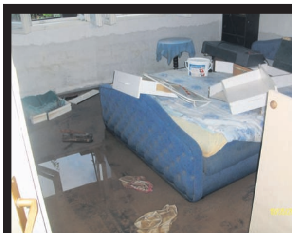
Razdejanje, ki ga je za seboj pustila voda.