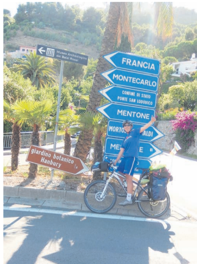
Največja težava, s katero se spopada, je močan veter, ki jo ovira med kolesarjenjem, zato je že večkrat morala sestopiti s kolesa in ga pogosto tiščati v hrib.

»To je čar potovanja – spoznavanje novih ljudi, sklepanje novih prijateljstev in vedno znova soočanje z dejstvom, da krasne ljudi, ki jih spoznaš, vsak dan znova zapuščaš.«