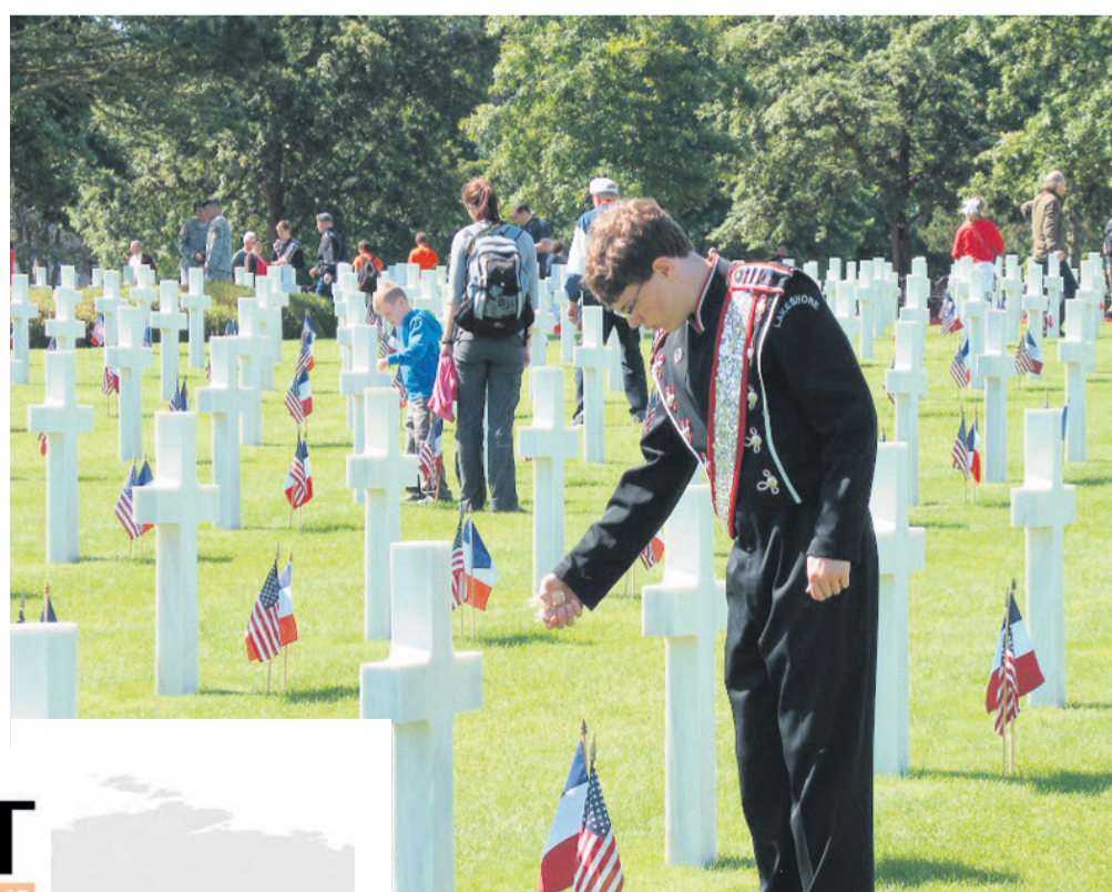
Ameriško pokopališče v Colleville-sur-Mer

Pokrovitelj akcije Navdušite nas s potopisom: www.optimist.si