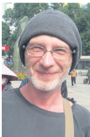
Piše: Peter Zupanc

Njeni starši mislijo, da prijateljica spi pri meni, moji starši mislijo, da spim pri njih. Denarja nimava veliko, ampak prespali bova tako in tako zastoj – in jutri bova že nazaj.« Takšna kratka potovanja v ukradenem prostem času brez denarja in s pomočjo sošolcev so nekaj, kar daje slutiti na malce drugačne odtise stopal na zemljevidu izkušeni.