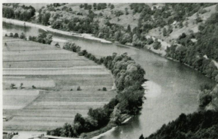
Pogled na reko Savo pri Kresnicah (foto: M. J.)