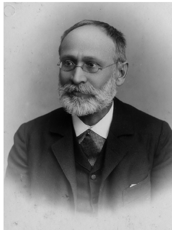
Slika 3: Dr. Franc Simonič, na Dunaju, ok. 1905

Svoje življenjsko delo je Simonič posvetil predvsem bibliografiji. Na lastno pobudo je začel zbirati in sistematično urejati slovensko knjižno produkcijo od prve Trubarjeve knjige do leta 1900. Med letoma 1903 in 1905 je pri Slovenski matici v treh snopičih