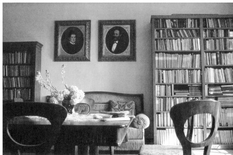
Slika 10: Družinska radgonska knjižnica danes

Vzdrževanje hiše, ki po babičini smrti, žal, nima več stalnih prebivalcev, postaja za preostale dediče vse težje breme, hkrati pa nostalgичni magnet, kraj za počitniško branje in sladostrastno brskanje pa zaprašeni arhivih. Spomeniško zaščiten stavba pod cerkvenim hribom se od leta 2006 ponaša s prenovljenim pročeljem, na dva od njenih zanimivih prebivalcev, Simoniča in Šlebingerja, bibliotekarja in utemeljitelja slovenske bibliografije, pa opozarja spominska plošča (Slika 11), ki so jo slovesno odkrili 13. oktobra 1963. Da je na pomembna rojaka ponosno tudi mesto, pričata njuni portretni poprsji, ki stojita v spominskem parku, tako imenovani Aleji velikih, 11 ki povezuje družinsko hišo Simonič-Šlebinger na Maistrovem trgu 4 z najstarejšo gornjeradgonsko stavbo – Špitalom, kjer so pred kratkim odprli muzejsko zbirko in tudi v tej postavitvi je dobila svoje mesto slovenski knjigi zavezana dvojica.