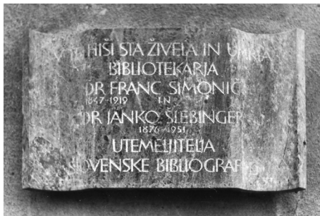
Slika 11: Spominska plošča utemeljiteljema slovenske bibliografije, odkrita na radgonski hiši 13. oktobra 1963