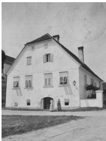
Slika 6: Simoničeva hiša v Gornji Radgoni, 1908

postavili imeniten spomenik. Tako se je na zakotnem pokopališču v Gornji Radgoni znašla Bernekerjeva 9 umetnina, doprsni globoki relief v cararskem marmorju.