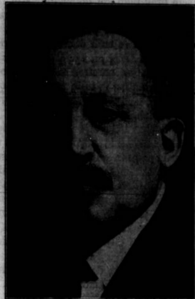
JAMES H. MAURER

S Ocialistični stranki je v čast in ponos, da ima na čelu svoje liste sodruška, ki sta vredna vsega zaupanja delavskega ljudstva. Izmed vseh kandidatov za predsednika Zed. držav je Norman Thomas najspodobnejši. Vrhutega je on izmed vseh tudi najbolj kremenit značaj. Uveljavil se je kot socialni delavec dolgo prej predno je postal socialist. V socialistično stranko je pristopil l. 1916. Privabilo ga je v njo odločno protivno stališče, kajti Thomas je neizprosno nasprotnik militarizma in vojne. Od tedaj se je njegov ugled v delavskem in socialističnem gibanju te dežele neprestano večal in veliko mislecev je, ki pravijo, da bo Thomas nekoč že predsednik te republike. Medtem ko sloves vodilnih kapitalističnih