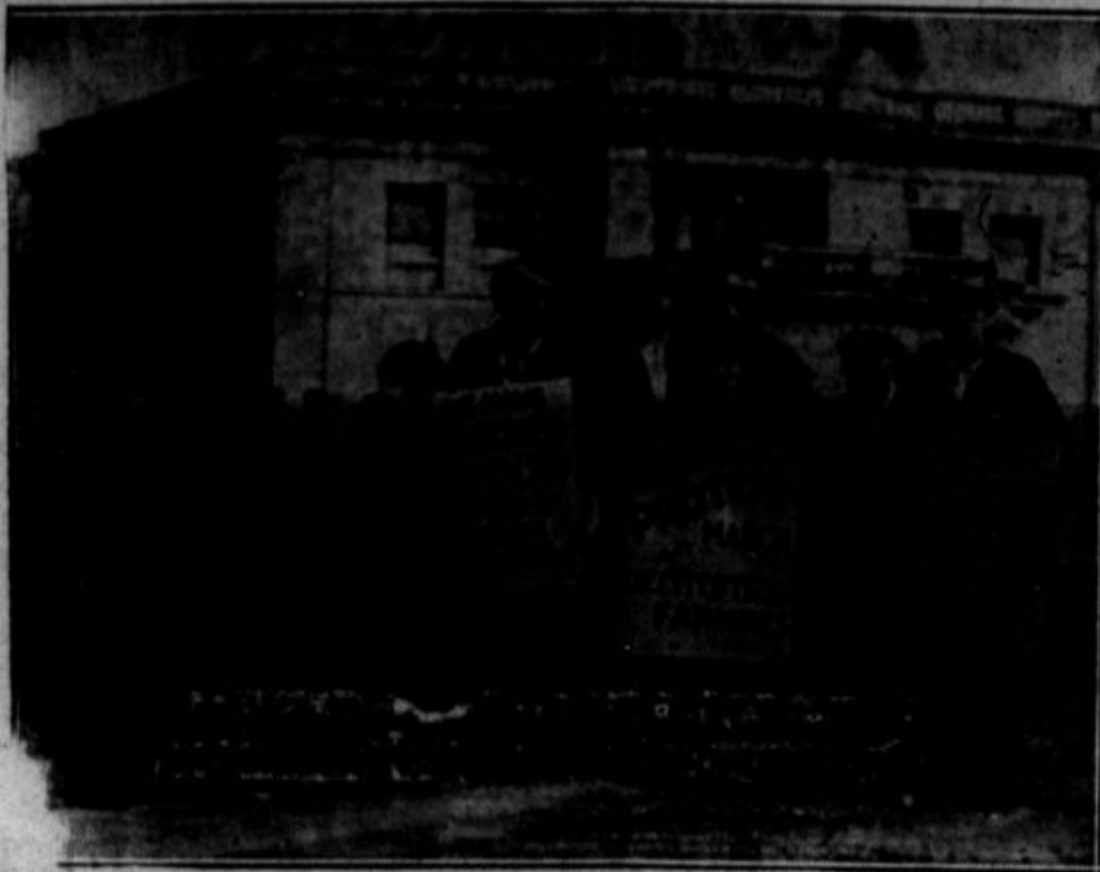
Nele farmarji v Zed. državah, nego tudi v Kanadi demonstrirajo proti mizernim razmeram, v katere so pahnjeni. Žal, da velika večina farmarjev ni še zapopadla, da je njihov žalostni položaj zakrivil kapitalizem, in da ga jim kapitalizem ne bo mogel izboljšati. Na tej sliki je skupina farmarjev v Manitobi, Kanada, ki so se nedavno organizirali za tridnevno demonstrativno pohod v Winni-peg. Zahtevali so, da vlada proglasi moralij na njihove dolgove in jim na ta način obvaruje kmetije pred bobnom.

cialisti v boju ne samo zato da dobimo veliko glasov, nego v namenu, DA ZMAGAMO pri TEH volitvah.