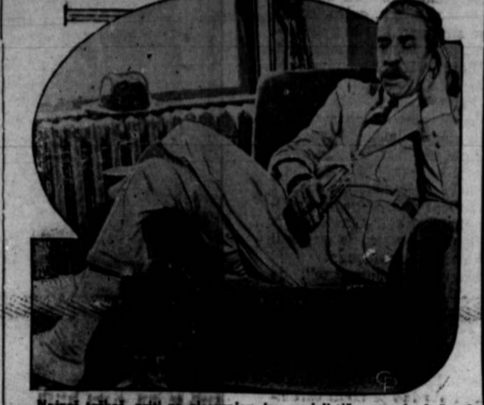
Največ težko, priti na glasovnico, ima socialistična stranka baš v državi, ki so pod kontrolo demokratske stranke. Ena teh je Oklahoma, kjer so dobili na nominalni glasovnici 40,000 podpisov, pa jih državna administracija ni hotela priznati. Socialisti so proti vladnemu odloku vložili pritožbo na vrhovno sodišče države Oklahoma, ki je odločilo na podlagi "tehničnih" razlogov, da ti podpisani opravljajo socialistično stranko do rubrike na glasovnici šele leta potem, ko so nabrali — torej drugo leto. Volitve pa se kajpada letos. Socialisti se z gotovostjo pričakuje, da dobi Norman Thomas v Oklahomi nad 100,000 glasov, ampak demokratska vladna in demokratska vrhovna sodišča hoče, da glasujejo le za demokrate, in kdor noče, pa naj glasuje za republikance. Norman Thomas je v svojem komentarju na ta reakcijski dekret dejal, da bodo demokrate dosegli s svojim postopanjem ravno nasprotni rezultat, kot pa ga nameravajo. Na sliki je govornik države Oklahoma, Alfalfa Bill Murray, ki so ga za radikalnega progresivca, v demokratski stranki, zato menda smatra, da druge radikalne stranke v njegovi državi vplivati ne smejo. Njegov radikalizem je seveda le v sanjah, kadar spi ali dremlja.