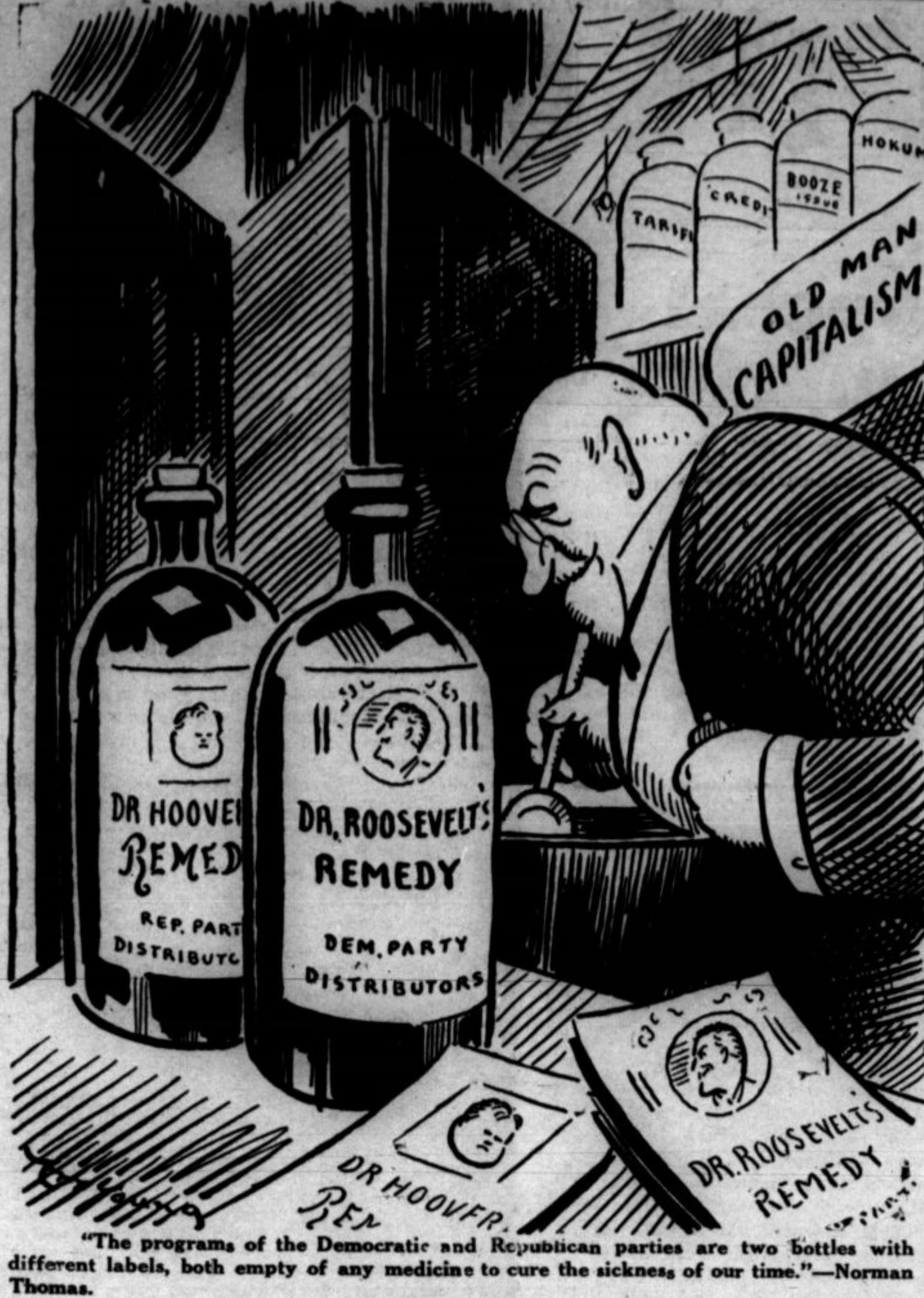
"The programs of the Democratic and Republican parties are two bottles with different labels, both empty of any medicine to cure the sickness of our time."—Norman Thomas.