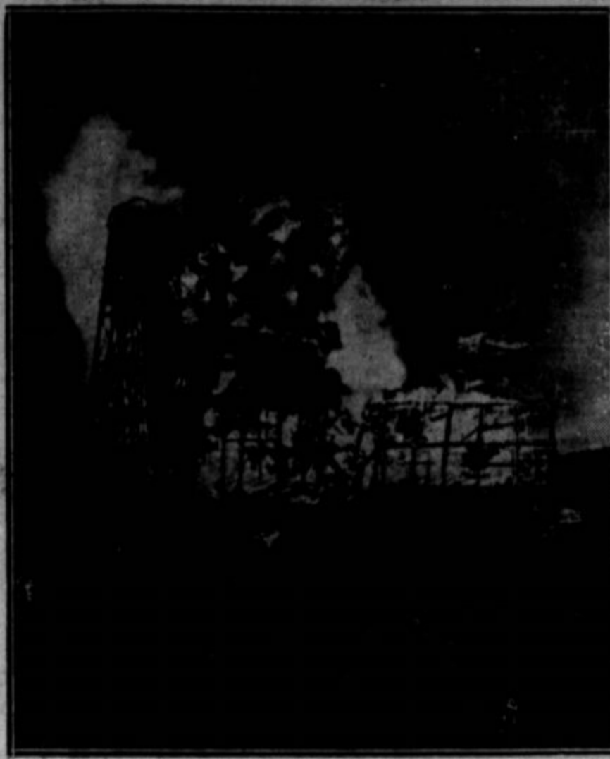
Naprava nad premogovnikom Glenn Alden kompanije v Wilkors-Barre, Pa., ki je v jeseni navadno zaposljal 1.800 delavcev, je uničil požar. Varnogarjem, ki so čakali na obnovitev obrata, je vzletel požar iz to nado. Večinoma so brez dela že od prošle zime.