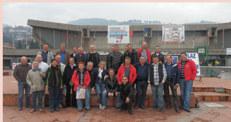
Udeleženci ekskurzije pred sejmiščnim vvhodom

Vsi, ki so se ekskurzije udeležili, so se strinjali, da je bila nepozabna in da jo je potrebno vsekakor čim prej ponoviti.