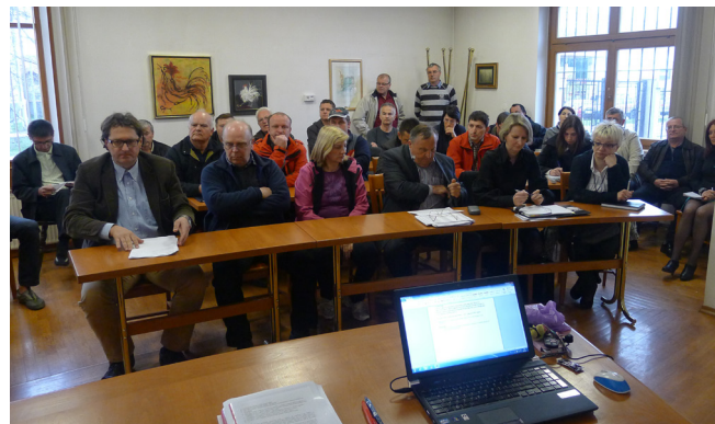
Velika predavalnica OÖZ Logatec je komaj sprejela vse, ki so jih prižadele odločbe o NUSZ za leto 2012