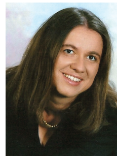
Pripravljala Barbara Grum Vogrin