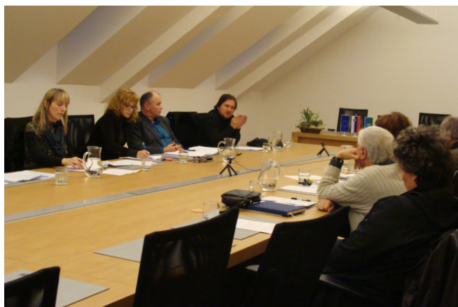
Z razširjene seje gospodarskega odbora Občine Cerknica