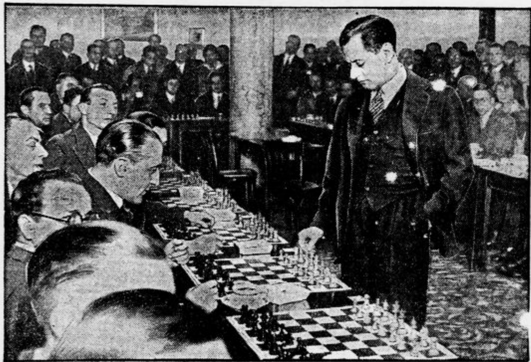
Capablancina igra 31 partij naenkrat

vloži 2000 dolarjev, dobi jih 18.000, dela tedaj z 900 odst. dobičkom... Da bi jo vrag!«