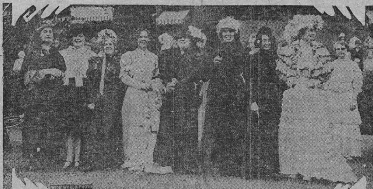
Večina izmed nas se še spominja na tiste "starodavne" čase pred kakimi 25 leti, ko so naše gospodične porabile trikrat toliko blaga za eno obleko, kakor ga porabijo danes. Kalifornijska trgovska in obrtna ženska zveza je na svoji konvenciji pokazala mlajšim članicam, kakšne so bile njih mame.