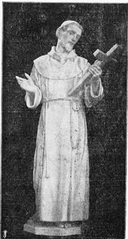
Sv. Frančišek. (Njegov god 4. oktobra.)

Ura ločitve je prišla. Veliki oče blagoslovi še enkrat svoje sinove in jim da svoj zadnji opomin. Bratje bridko jokajo.