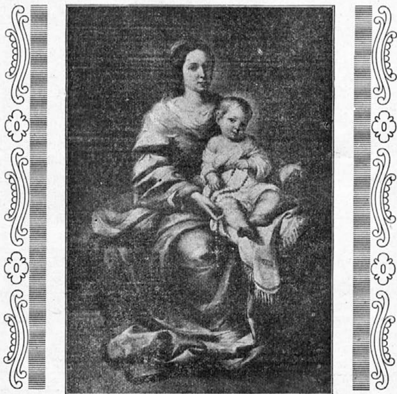
Kraljica sv. rožnega venca.

Mesec oktober je posvečen Kraljici presv. rožnega venca. Vneti Marijini častilci zelo radi molijo sv. rožni venec. Po-