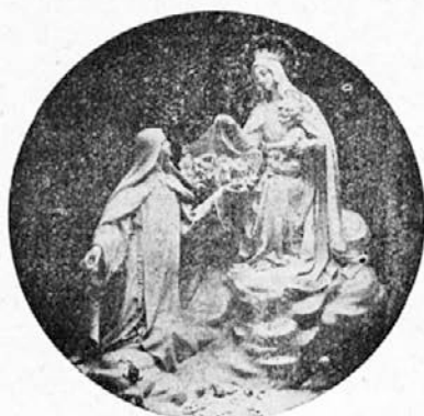
Sv. Terezija od Deteta Jezusa.

30. septembra leta 1897. je zletela mala Terezija v nebesa zato, da bi od tam trosila na zemljo rože veselja in milosti posebno na svoje ljubljenske — otroke. Ko bom bral 3. oktobra njej na čast sv. mašo, bom tako le molil: