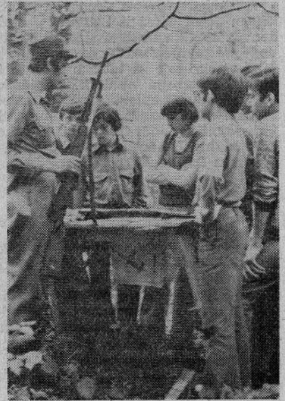
Spoznavanje orožja je za najmlajše še zlasti privlačno

Med petimi ekipami so bili v šahu najboljši vojaki karavle Savinjski partizan, ki so v finalu premagali Postajo milice. Na tretje mesto so se uvrstili vojaki karavle Sv. Duh, tretje in četrto pa so si razdelili mladinci iz Luč in Solčave.