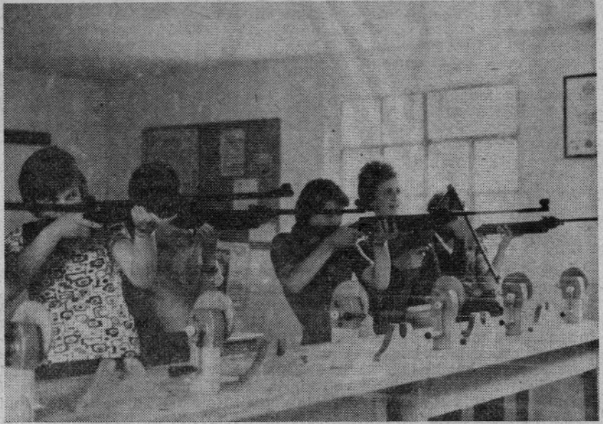
Tudi pionirke si z veseljem pridobivajo strelskih veščin

Ekipno je v streljanju zmagalo moštvo Postaje milice Mozirje v po-