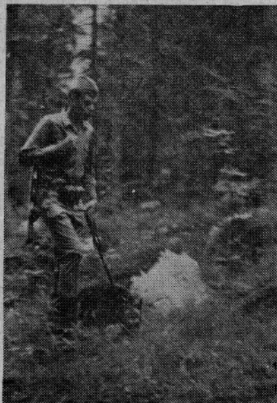
Zvesti čuvaji meja