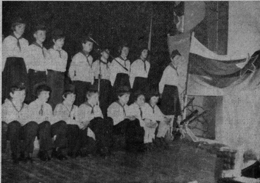
Gornjegrajski petošolci so se na proslavi resnično izkazali