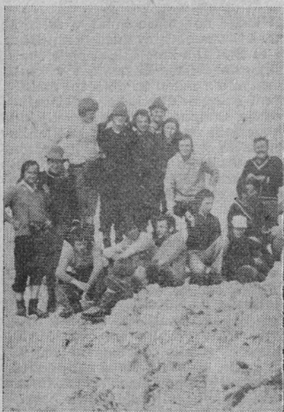
Na vrhu Ojstrice

(Zaradi pomanjkanja prostora nadaljevanje v prihodnji številki.)