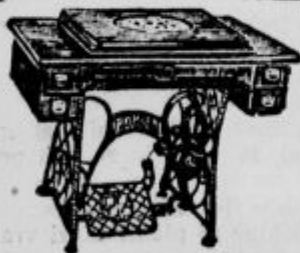
Priloga se tudi na čuroke.