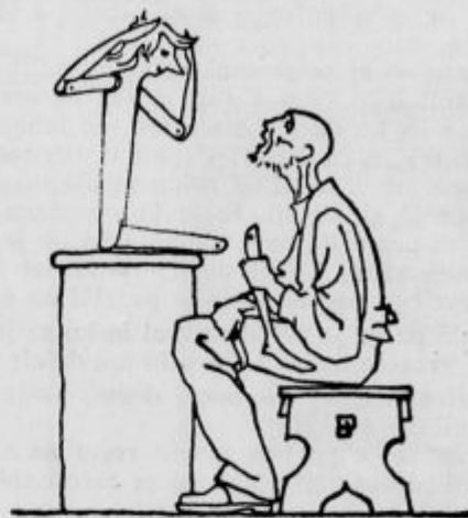
...svojo rameno lasuljo v lutkovi

Komaj sta bili roki gotovi, je začutil Pepek, da mu je zginila lasulja z glave. Pogledal je v vis in kaj je videl? Videl je svojo rumeno lasuljo v lutkovih roki.