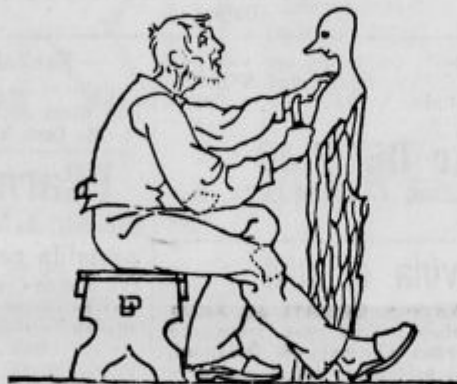
...je vzel orodje in začel delati in rezati svojega lutka.

Jedva je vstopil Pepek v hišo, je vzel orodje in začel delati in rezati lutke.